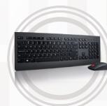
Lenovo Professional Wireless Tastatur- und Mauskombination