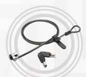
Kensington® Kabelschloss mit zwei Schlössern von Lenovo™