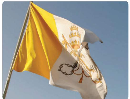
Gelb-Weiss, Tiara und Petruschlüssel: Diese Flagge weist auf eine Einrichtung des Heiligen Stuhls hin, wie eine Nuntiatur