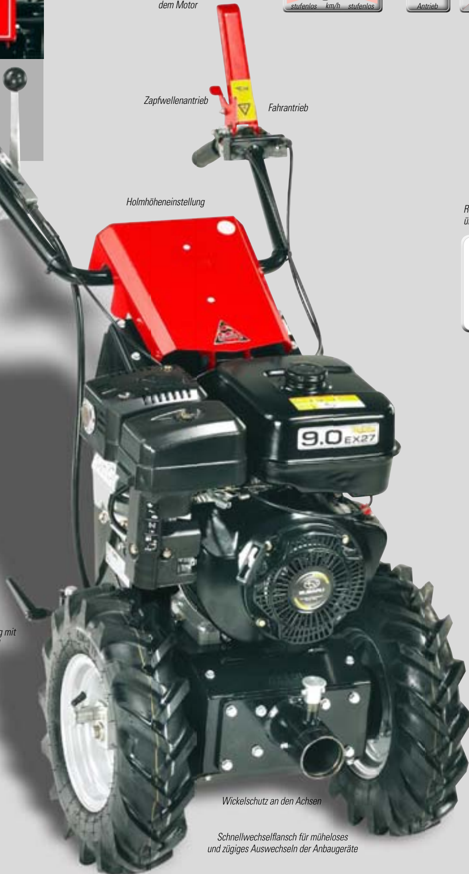
Schnellwechselfansch für müheloses und zügiges Auswechseln der Anbaugeräte