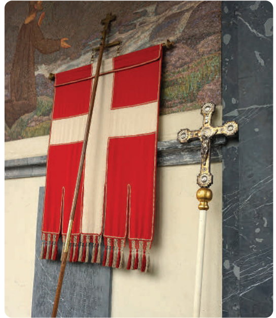
Zwei Symbole, die zu jeder Nidwaldner Wallfahrt dazugehören: Das Vortragskreuz mit dem Gekreuzigten und die Nidwaldnerfarben (rot/silber)