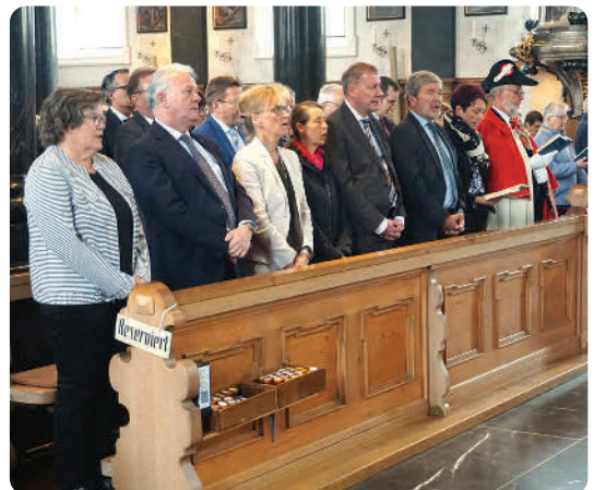
Die Nidwaldner Regierung war in corpore dabei, und mit ihr Vertretungen der Evangelisch-Reformierten und Römisch-Katholischen Kirche des Kantons