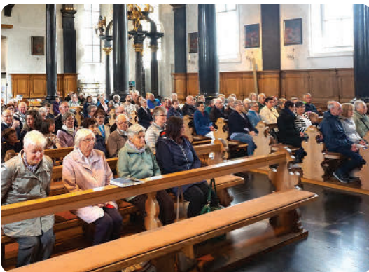
Mit Bahn, Bus und Auto sind sie gekommen, um für Kanton und Land und besonders für Frieden zu beten