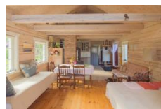
Royal Amber House, innen