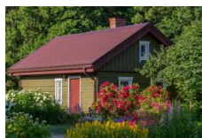
Royal Amber House

Ruhe erwartet dich mit dem Rauschen des Meeres durch das offene Fenster, die litauische Wiese voller Wildblumen, alten Eichen, und Wald, dem Weg zum Meer, den Wellen und dem Sand der Ostsee, diesem heilenden blauen Farbton und der gemütlichen und komfortablen Umgebung.