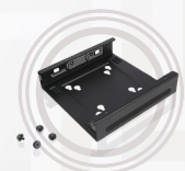
ThinkCentre Tiny VESA-Halterung II