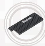
ThinkCentre Tiny IV 1L Staubschutz