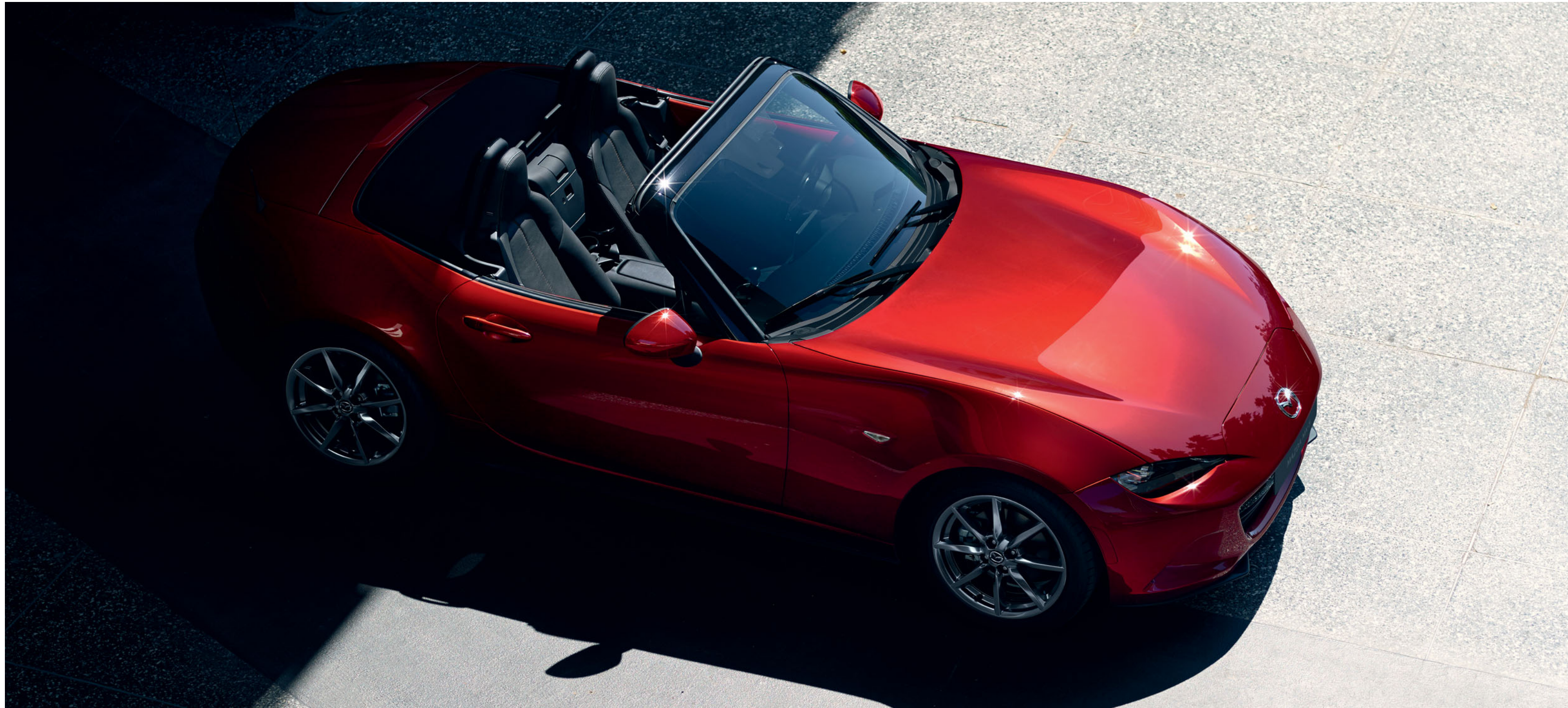
Mazda MX-5 Roadster in Soul Red Crystal