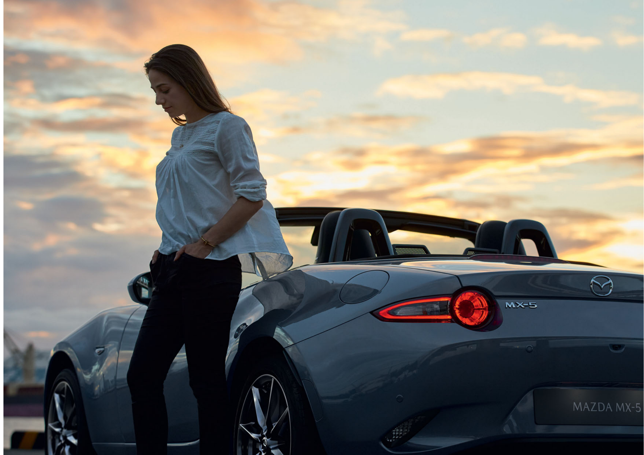
Mazda MX-5 Roadster in Polymetal Gray

Wir erkunden Städte und kurvige Landstrassen, geben Gas und bringen den Motor auf Touren. Mit geöffnetem Dach, auch an kalten Wintertagen. Unter den Sternen, dem Wind trotzend. Wir sind füreinander bestimmt. Jinba Ittai – wie Ross und Reiter verschmelzen Fahrzeug und Fahrer zu einer Einheit. Wir suchten schon immer eine Verbindung, die sich mit Worten kaum beschreiben lässt. Uns vereint pure Leidenschaft. Gemeinsam sind wir stärker und nie mehr allein.