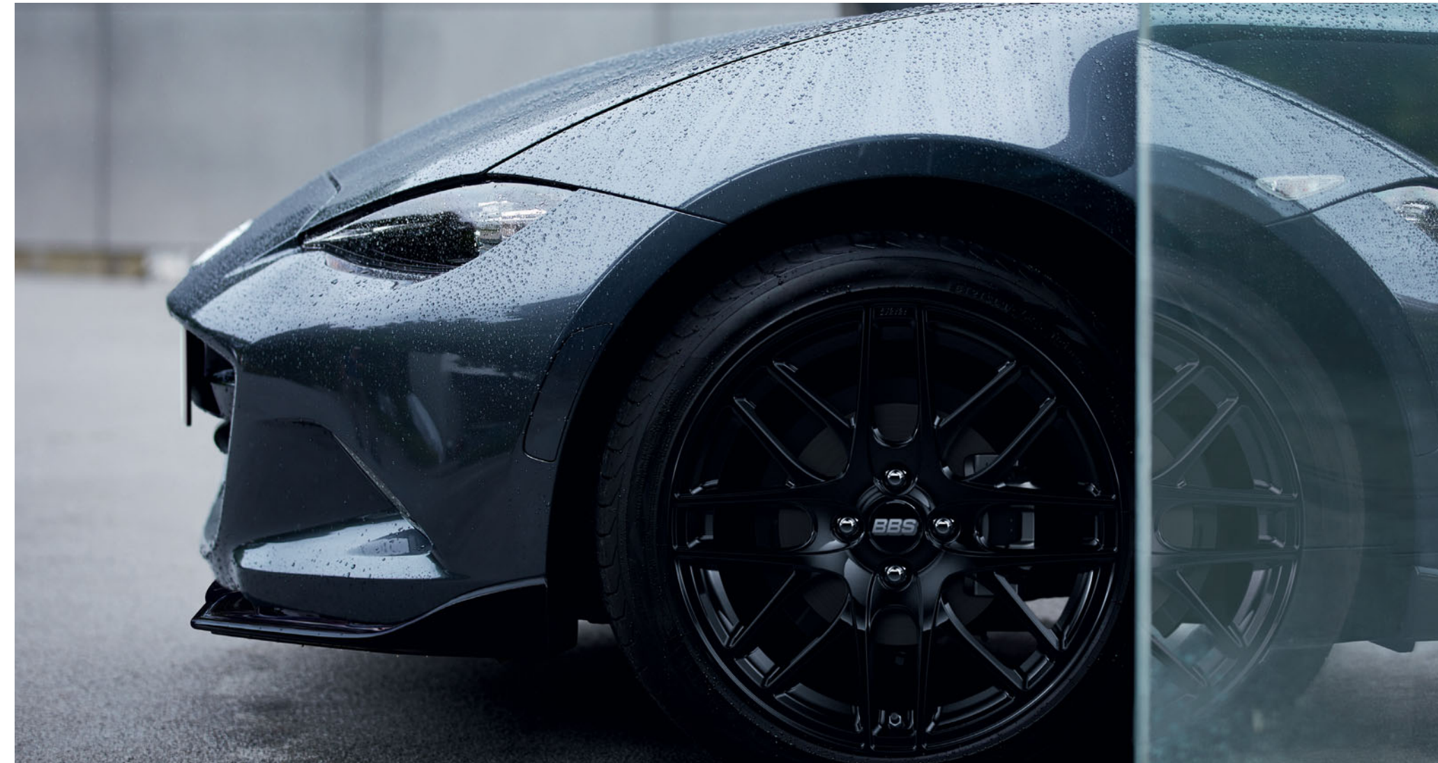
Frontschürze in Brilliant Black