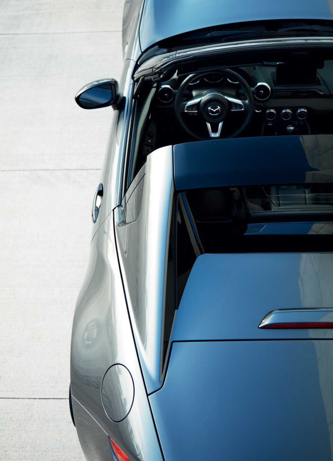
Mazda MX-5 RF in Machine Gray und Mazda MX-5 Roadster in Soul Red Crystal