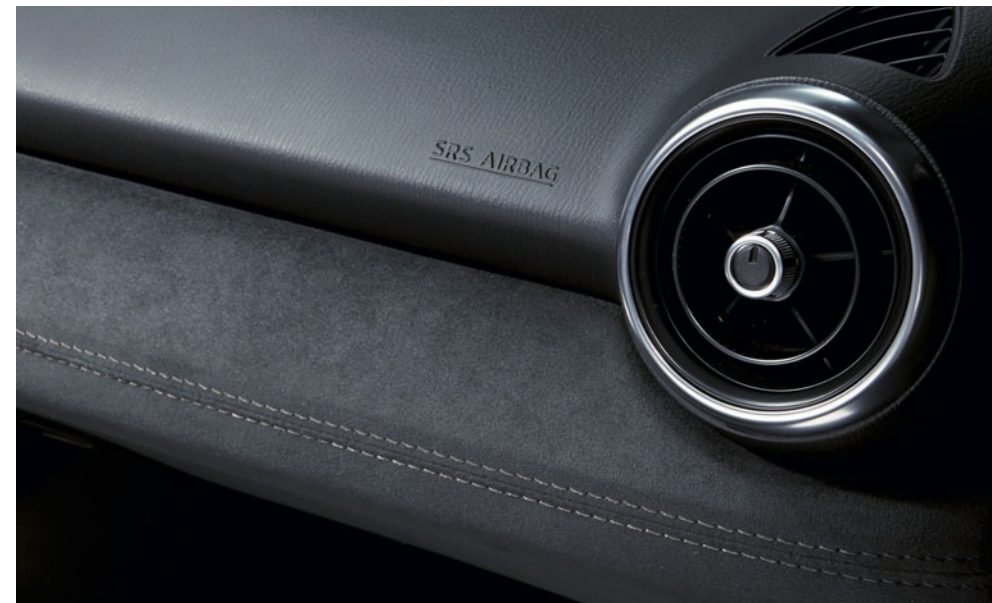
Armaturenbrettleiste in Alcantara®