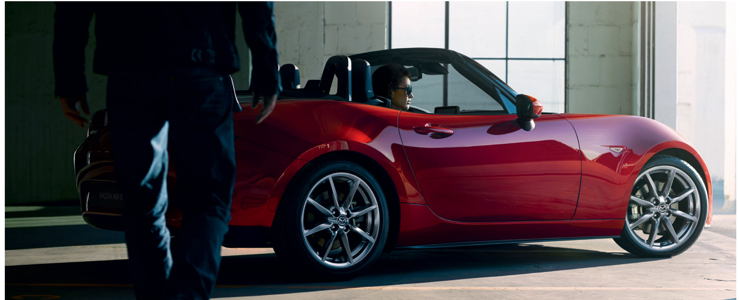
Mazda MX-5 Roadster in Soul Red Crystal

Die sicherste Fahrt ist immer diejenige, bei der Unfälle von vornherein verhindert werden. Unsere intelligenten und innovativen i-Activsense-Sicherheitstechnologien warnen Sie vor Gefahren und helfen, Kollisionen zu vermeiden oder abzuschwächen. Funktionen wie der Spurwechselassistent mit Totwinkelwarner BSM oder der Spurhalteassistent LDWS erhöhen die Verkehrswahrnehmung, und bei Bedarf bremsen die i-Activsense-Technologien sogar automatisch. All das gibt Ihnen rundum ein Gefühl der Sicherheit, sodass Sie sich ganz auf das Fahren konzentrieren können.