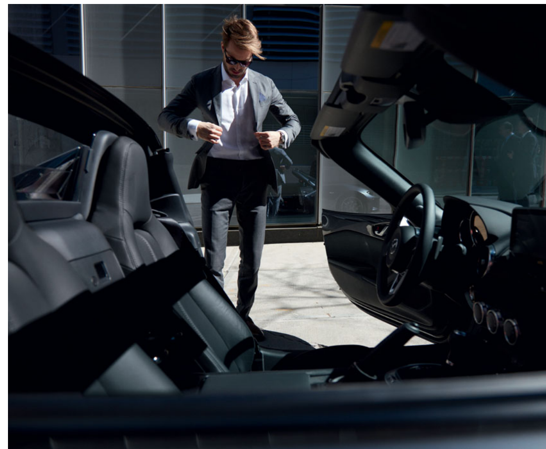
Mazda MX-5 RF in Machine Gray