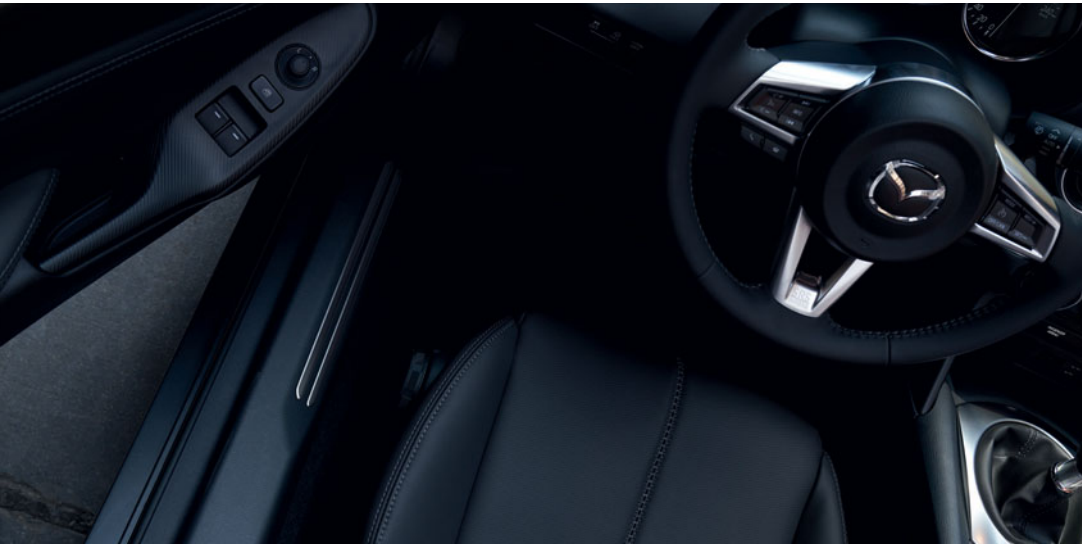
Mazda MX-5 RF in Machine Gray

Erleben Sie das pure Fahrvergnügen im Mazda MX-5 RF. Der ikonische Roadster mit Fastback-Klappdach begeistert nicht nur den Fahrer, sondern auch den Betrachter. Sein beeindruckendes Design ist eine unwiderstehliche Einladung, sich ans Steuer zu setzen und das einzigartige Gefühl der Einheit von Fahrzeug und Fahrer zu erleben, das wir Jinba Ittai nennen. Alle Funktionen und Details tragen zu einem souveränen und anregenden Fahrerlebnis bei. Das klappbare Fastback-Dach weckt Ihre Sinne: Erleben Sie alles, von entspanntem Komfort über uneingeschränktes Vertrauen bis hin zum Gefühl, voll sprühender Energie zu sein. Das ist es, was entsteht, wenn bei Design und Entwicklung Emotionen an erster Stelle stehen.