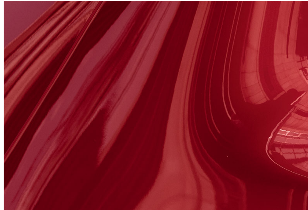
Soul Red Crystal