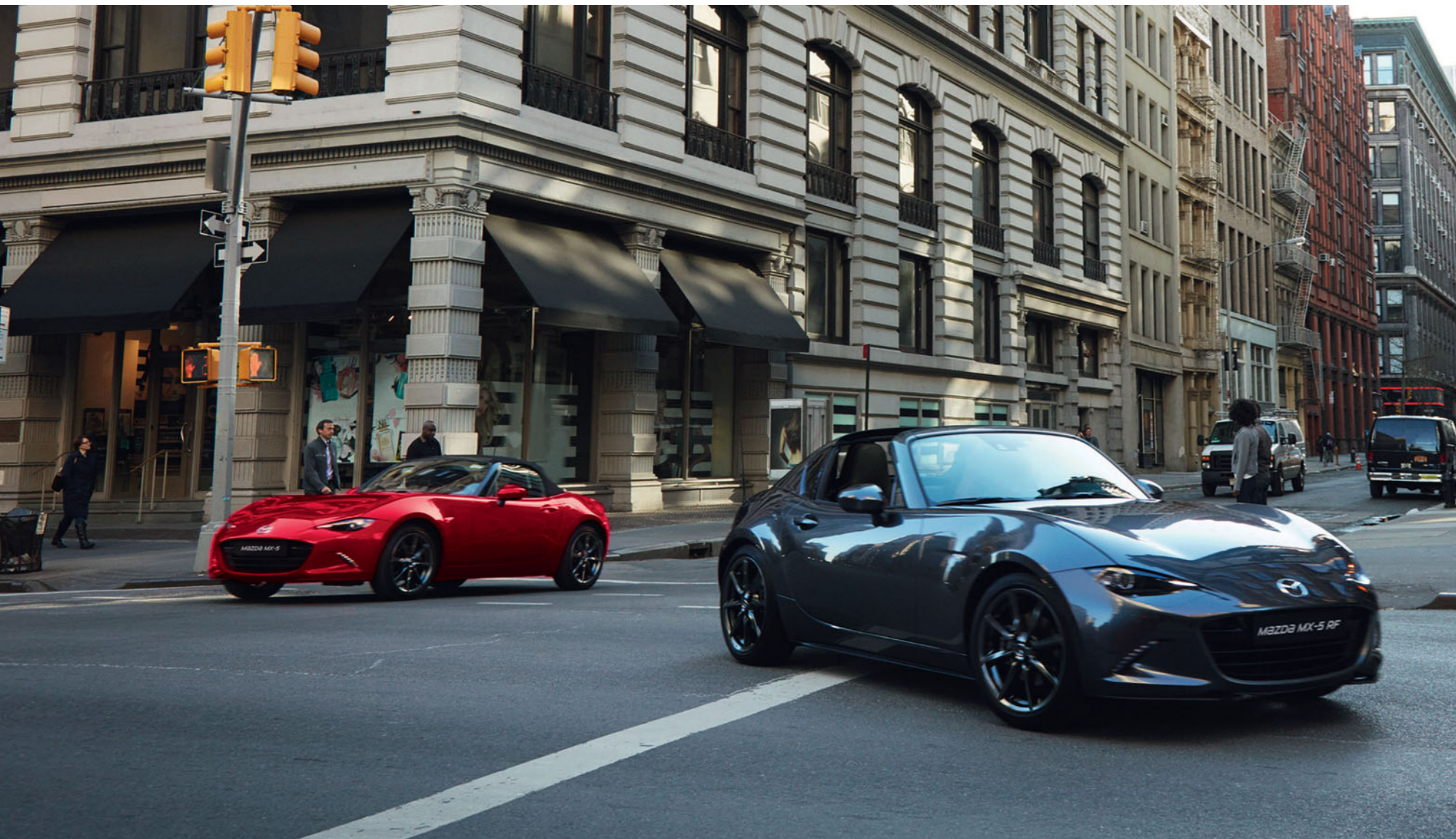
Mazda MX-5 Roadster in Soul Red Crystal und Mazda MX-5 RF in Machine Gray

Die Mazda MX-5 Roadster und Mazda MX-5 RF in dieser Broschüre sind jeweils in der Version Revolution Skyactiv-G 184 abgebildet. Details dazu entnehmen Sie bitte der Ausstattungsliste.