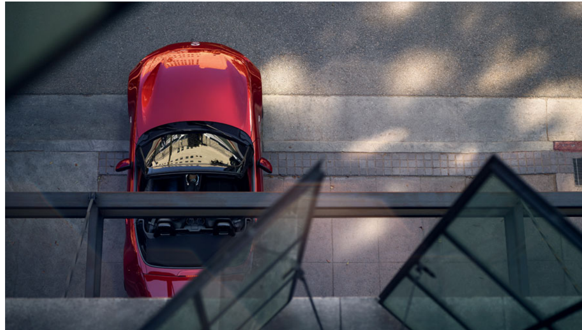
Mazda MX-5 Roadster in Polymetal Gray und in Soul Red Crystal (linkes Bild)

Der Mazda MX-5 Roadster verschlägt Ihnen den Atem, noch bevor Sie ihn fahren. Er ist das Ergebnis unseres Anspruchs, das perfekte Fahrerlebnis zu schaffen. Sobald Sie am Steuer sitzen, sind all Ihre Sinne geschärft. Sie spüren sofort das Gefühl der Einheit von Fahrzeug und Fahrer in seiner ultimativen Form. Im Mazda MX-5 Roadster verschmelzen vollendete Ästhetik, meisterliches Handwerk und anspruchsvolle Ingenieurskunst zu einem unvergleichlich harmonischen Ganzen. Spüren Sie die Energie und die einzigartige Verbundenheit mit Ihrem Fahrzeug – spüren Sie Fahrspass pur!