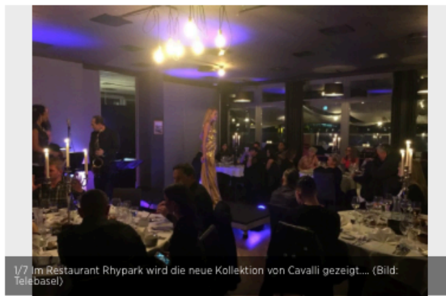
1/7 Im Restaurant RhyPark wird die neue Kollektion von Cavalli gezeigt....