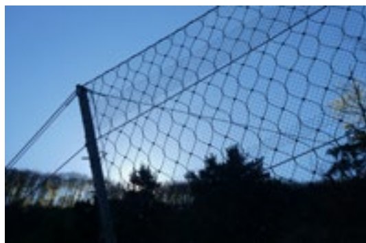
Schützende Netze auf dem Weg nach Kehrsiten

Mögen Sie im Leben immer wieder auf tragende und verbindende Netze zählen dürfen!