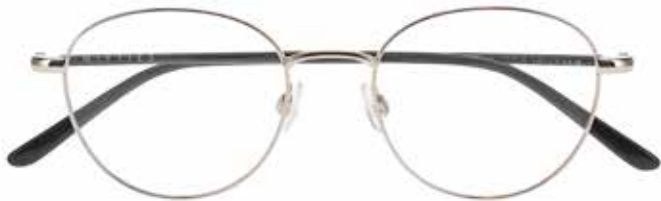
NI 8532 c.2012 – 48/18-140 B: 42

STAINLESS STEEL TWO MASCULINE SHAPES 4 COLOURS EACH