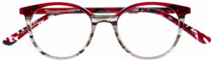
NI 9498 c.3945 – 46/17-140 B: 40