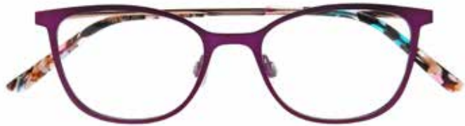
NI 8527 c.3431 – 48/17-140 B: 37

STAINLESS STEEL TWO FEMININE SHAPES 4 COLOURS EACH