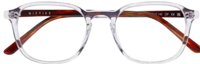
NI 9504 c.1115 – 46/18-140 B: 41