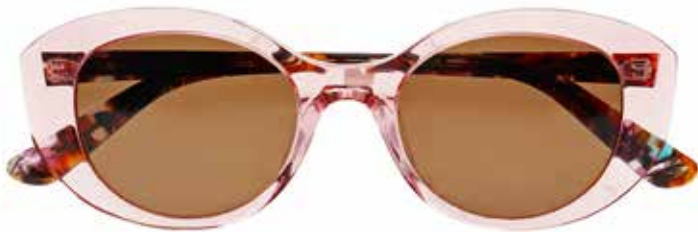
NI 9859 c.4315 – 48/19-140 B: 40