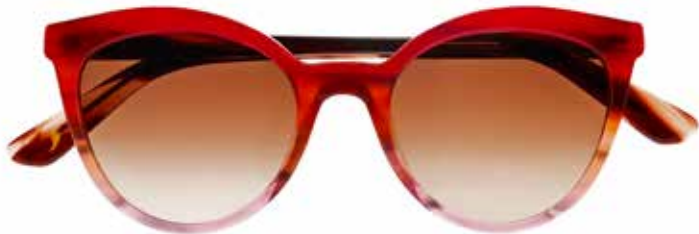
NI 9857 c.3745 – 48/19-140 B: 42