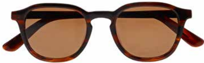
NI 9861 c.5435 – 46/20-140 B: 39