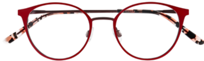
NI 8531 c.4021 – 47/18-140 B: 41

STAINLESS STEEL ONE FEMININE SHAPE 4 COLOURS