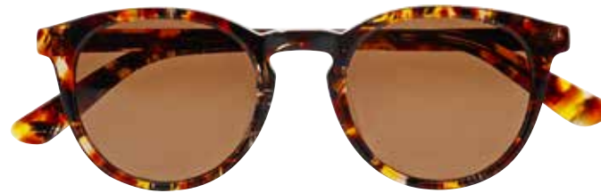
NI 9862 c.4635 – 46/21-140 B: 42