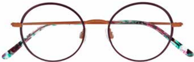
NI 8529 c.3931 – 46/18-140 B: 43

STAINLESS STEEL TWO FEMININE SHAPES 4 COLOURS EACH