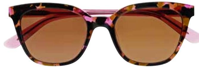
NI 9858 c.4335 – 50/19-140 B: 41