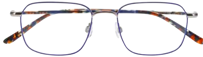
NI 8533 c.9121 – 49/17-140 B: 38