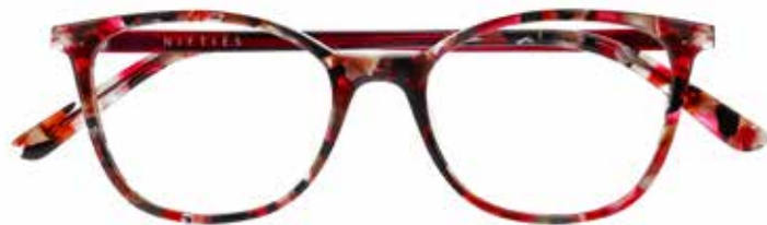
NI 9501 c.4124 – 49/17-140 B: 39

ACETATE TWO FEMININE SHAPES 4 COLOURS EACH