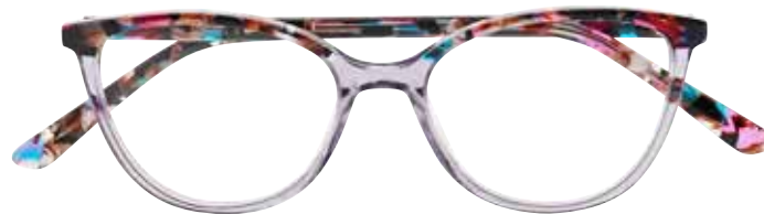
NI 9499 c.3544 – 49/16-140 B: 39