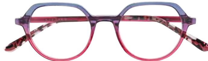
NI 9502 c.3545 – 46/18-140 B: 41