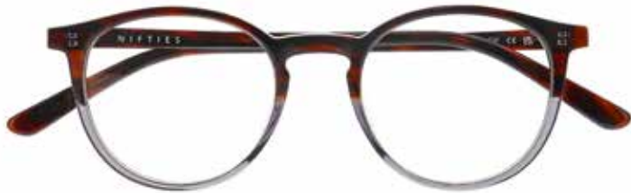
NI 9503 c.5444 – 47/19-140 B: 42

ACETATE TWO MASCULINE SHAPES 4 COLOURS EACH