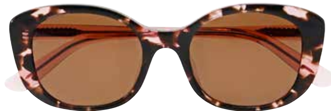
NI 9860 c.4335 – 49/19-140 B: 43