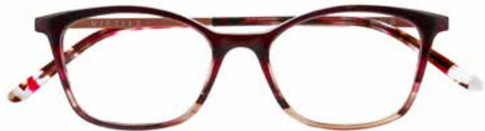
NI 9500 c.3844 – 48/16-140 B: 36