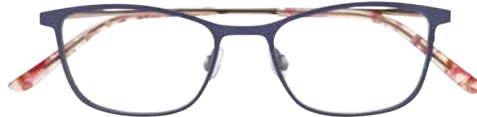
NI 8528 c.9031 – 48/17-140 B: 35