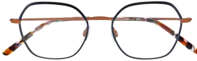
NI 8530 c.9331 – 48/18-140 B: 41