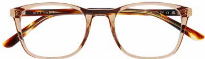
NI 9505 c.5015 – 49/19-140 B: 39