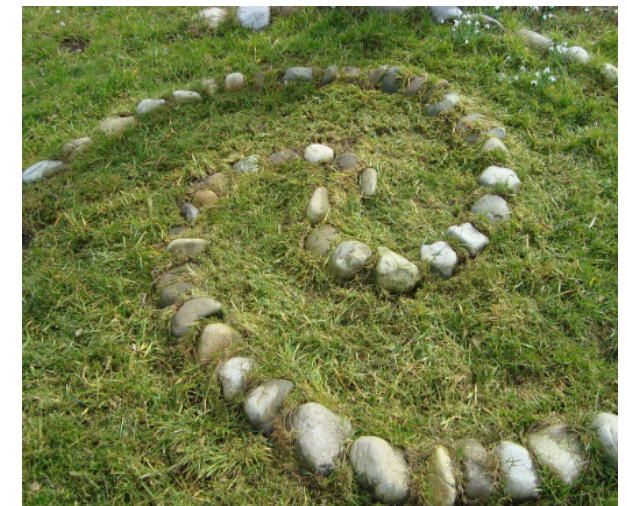
Rechtsdrehende Doppelspirale in einem Garten

Radiästhesie ist das feinstoffliche Erspüren (Muten) von Wasseradern , geologischen Strukturen oder technomantischen Einflüssen mit der Rute.