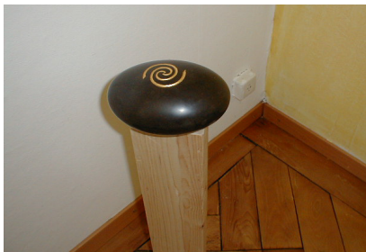
Lithopunktur in der Wohnung

Der TimeWaver nutzt den Lichtquanteneffekt für die Balancierung von Mensch und Wohnung