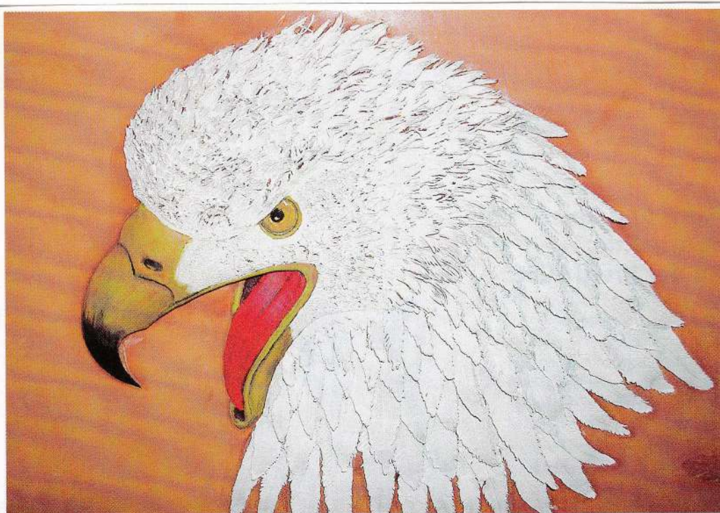
■ Lederbild von Bernhard Franz aus Bern.

DIE FÜHRENDE FACHZEITSCHRIFT FÜR DIE GESAMTE INNENEINRICHTUNGSBRANCHE LE MAGAZINE PROFESSIONNEL LEADER DE L'ENSEMBLE DE LA BRANCHE DE L'AMÉNAGEMENT INTÉRIEUR