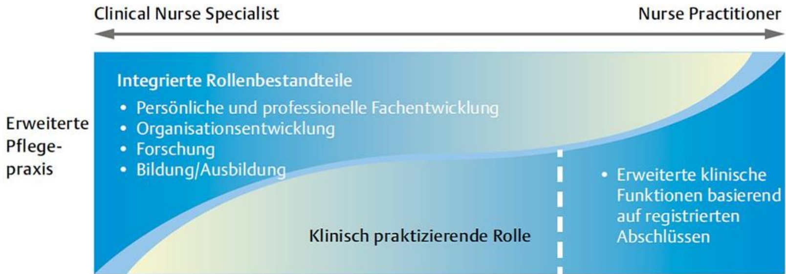
Abb. 2 Die Ausprägung von APN-Rollen (nach Bryant-Lukosius D. (2004, 2008) 1 , dt. Übersetzung durch die Autoren dieses Artikels).