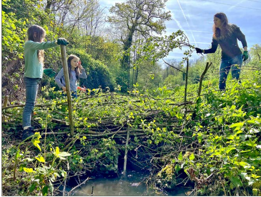
Impressionen aus der Herzogenmatt

Rund zehn Helfer sind für den Einsatz am Samstag Morgen im Naturschutzgebiet bereit. Ein Tümpel muss noch von einem Teil der Pflanzen befreit werden und so den Wasserbewohnern genügend freie Wasserfläche zur Verfügung zu stellen. Der Biber ist noch nicht am Weierbach erschienen. Deshalb hat