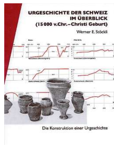
Werner E. Stöckli: «Urgeschichte der Schweiz im Überblick», veröffentlicht von Archäologie Schweiz . 356 Seiten, 230 Abbildungen. 89 Franken.

Stöcklis Vermutung: Vielleicht sei der Drusus-Feldzug – von dem kaum Spuren geblieben seien – gar nicht so bedeutend gewesen und nur überliefert, weil Drusus als Stiefsohn von Kaiser Augustus prominent gewesen sei. (JFP)