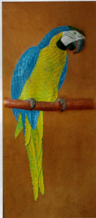
Gelbbrust Ara - Leder

In verschiedenen Schritten erfolgt dann die Bemalung.