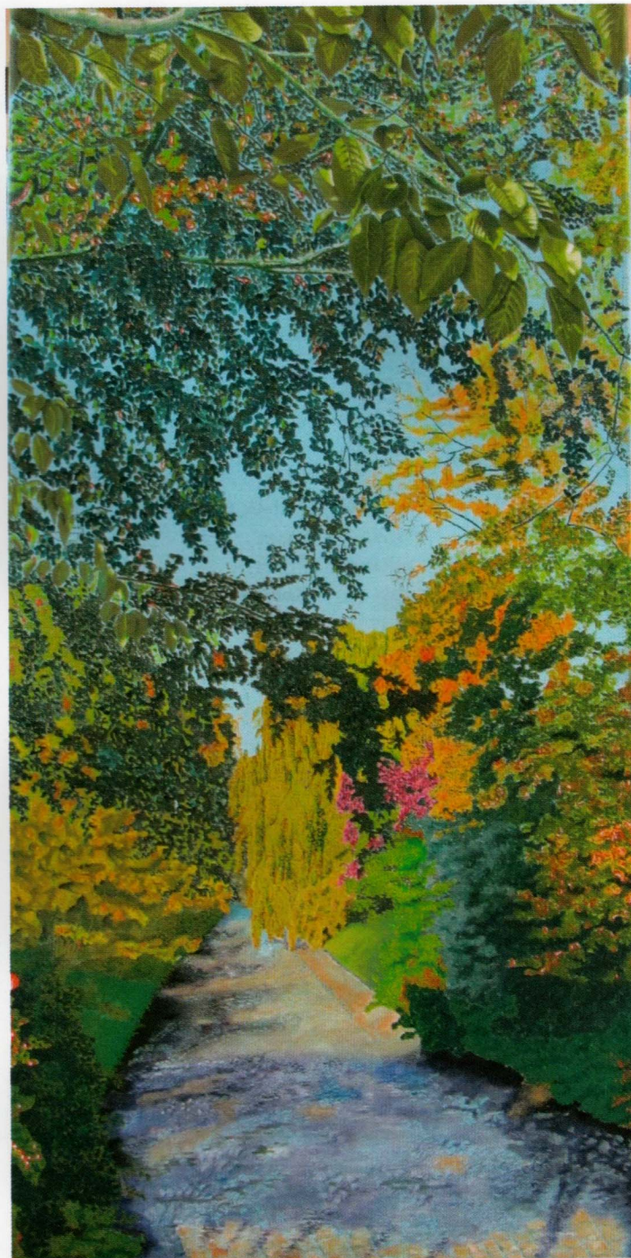
Oosbach, Lichtentaler Allee, Baden-Baden - Oel auf Leinwand

Die Vielseitigkeit des Künstlers zeigt sich in seinen Arbeitstechniken.