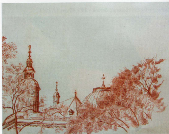
Stiftskirche, Friedrichsbad in Baden-Baden - Rötel

Handwerkskunst und/oder Kunsth Handwerk = Kunst in faszinierender Optik.