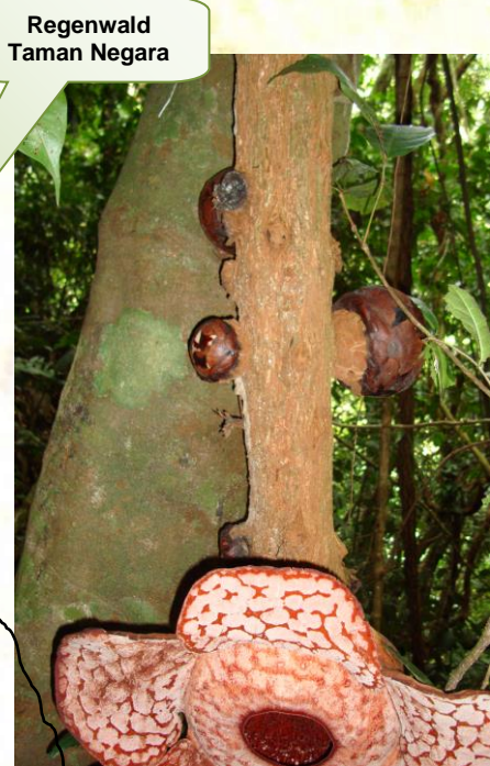
Regenwald Taman Negara