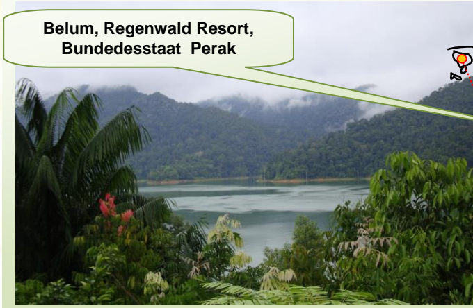
Belum, Regenwald Resort, Bundesstaat Perak