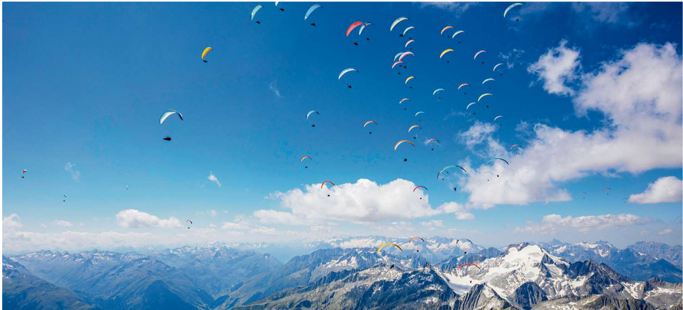
Quest'jamna semesiran varga 120 parasguladras e parasguladers als campiunadis svizzers a Mustér.