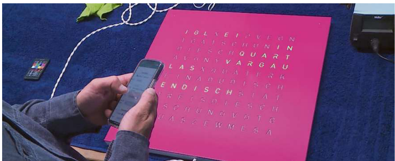
Per programmar quell'ura drovi ina applicaziun speciala ch'ei era per romontsch.