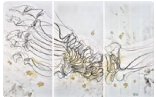
Hungertuch Fastenopfer 2021

Leider kann im Anschluss kein Fastensuppenessen stattfinden.