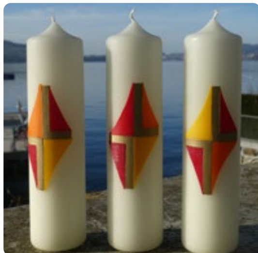
Kreuz der Hoffnung