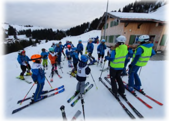
Tony Sport Rennen