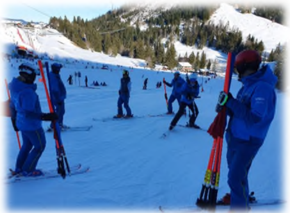
Interne Weiterbildung «Steckkurs»