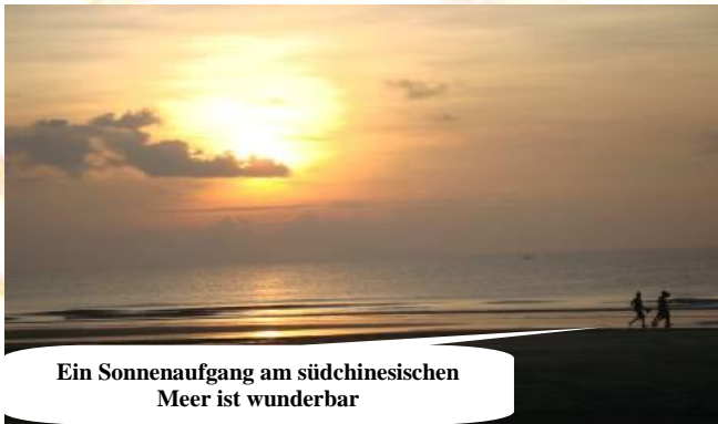
Ein Sonnenaufgang am südchinesischen Meer ist wunderbar