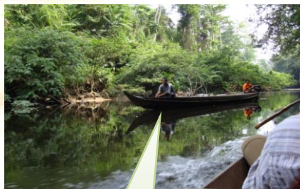
Eine Flussfahrt auf dem Sungai Tahan im Taman Negara?

Oder / und den Royal Belum Regenwald, der den Tasik Temerggor umgibt, erkunden und eine darin wachsende Rafflesia Cantalyii sogar bestaunen. Im Regenwald die Fauna sehen und Tiere beobachten.