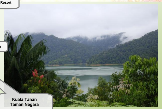
Kuala Tahan Taman Negara