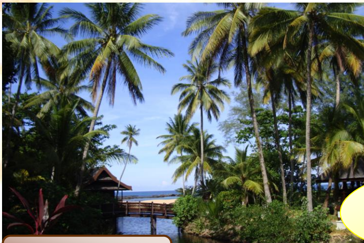
Hotelanlage vom Tanjong Jara Resort