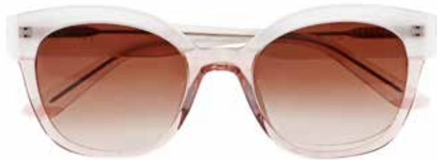
IF 9865 c.1712 – 51/20-140 B: 43