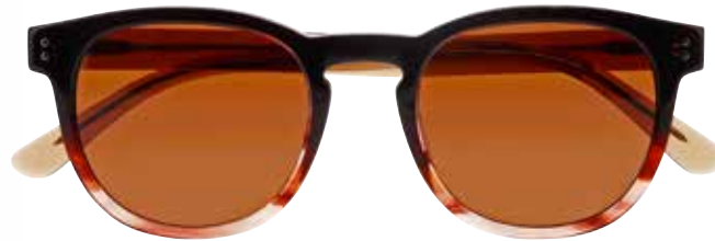
IF 9870 c.5042 – 50/21-145 B: 44