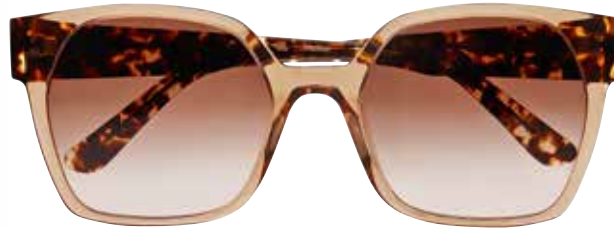
IF 9864 c.5015 – 55/20-140 B: 50