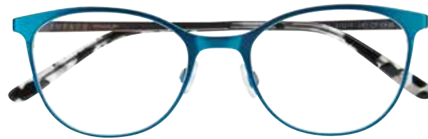
IF 1476 c.8521 – 51/19-140 B: 41