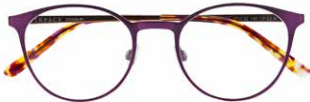
IF 1475 c.3021 – 49/20-140 B: 43