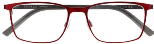
IF 1473 c.4021 – 55/18-150 B: 39