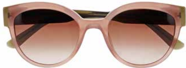
IF 9863 c.1722 – 52/20-140 B: 44