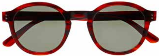
IF 9867 c.4924 – 49/23-145 B: 46