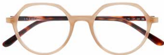
IF 9490 c.1722 – 48/19-140 B: 44