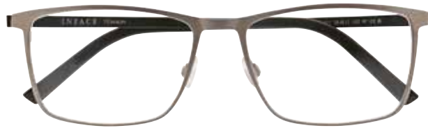
IF 1474 c.6521 – 58/17-150 B: 42