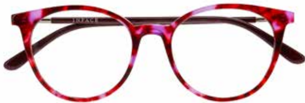
IF 9495 c.4024 – 50/17-140 B: 44