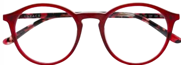
IF 9491 c.3722 – 50/20-140 B: 46