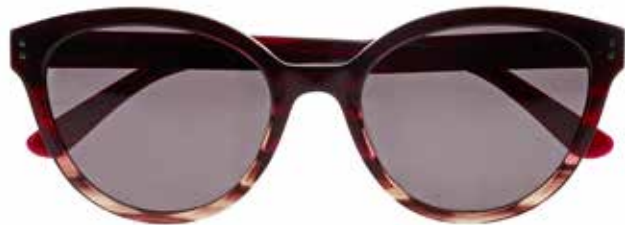
IF 9869 c.3742 – 54/19-140 B: 45