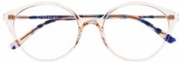
IF 9497 c.1712 – 53/19-140 B: 47