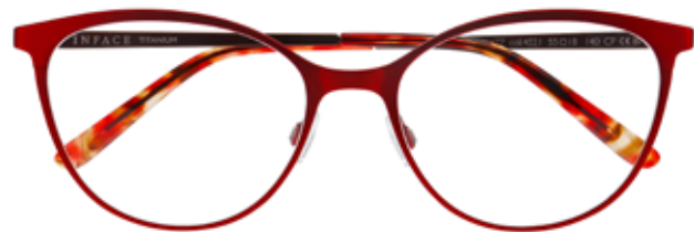
IF 1477 c.4021 – 55/18-140 B: 44