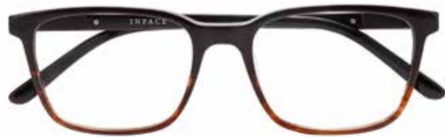
IF 9493 c.5042 – 54/18-145 B: 43