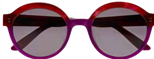
IF 9866 c.3024 – 52/21-140 B: 47