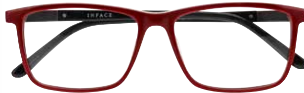
IF 9494 c.4022 – 58/16-150 B: 42