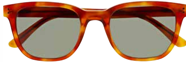
IF 9868 c.5014 – 52/21-140 B: 43