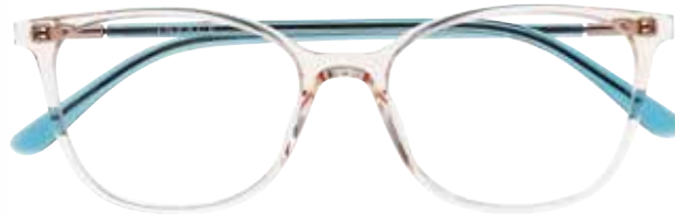
IF 9496 c.1712 – 52/17-140 B: 41