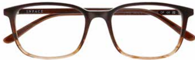
IF 9492 c.5042 – 54/18-145 B: 40