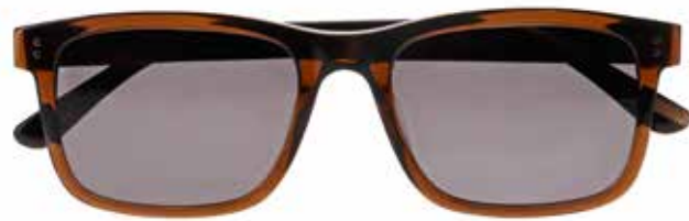
IF 9871 c.5025 – 55/19-150 B: 41