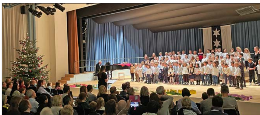
Drei Kindergärten und zwei 1. Klassen vom Meiriacker-Schulhaus

Eltern, Grosseltern, Geschwister und Familienfreunde durften dank der verbindenden Kraft der Musik einen berührenden Adventsabend erleben.