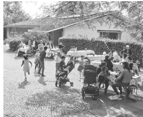
Tag der Nachbarn

Es ist immer wieder eindrücklich, wie engagiert und talentiert sich die Kinder beim Kochen, Serviertablet balancieren oder Kopfrechnen anstellen. Neben dem Kafibetrieb fand auf dem