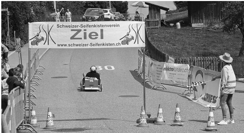
QV Tschudiwies – CENTRUM im Ziel