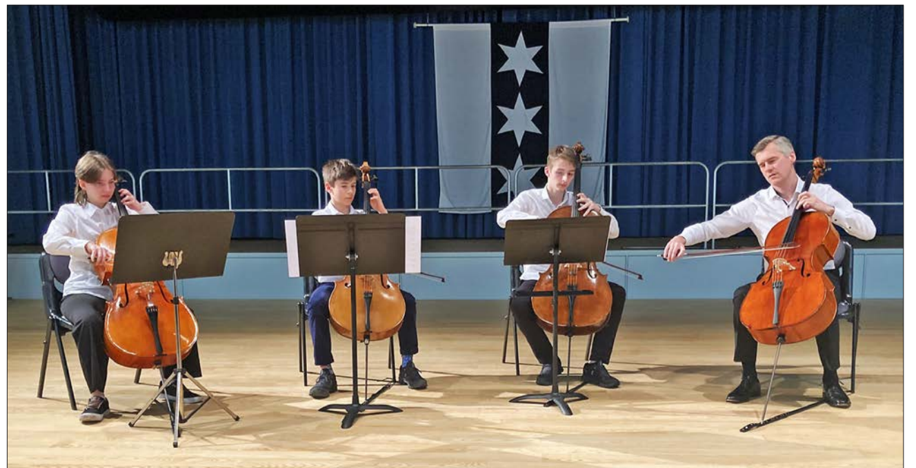
Das Cello Quartett der MS Binningen-Bottmingen