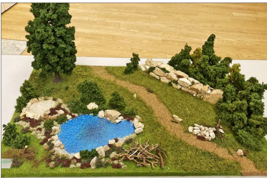
Modell wie die Gärten aussehen könnten.