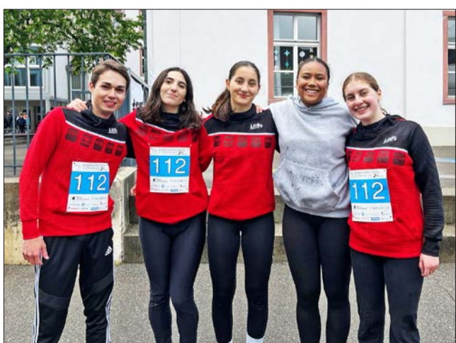
LAR Quer durch Basel: Mixed Team