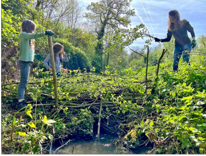
Impressionen aus der Herzogenmatt

Rund zehn Helfer sind für den Einsatz am Samstag Morgen im Naturschutzgebiet bereit. Ein Tümpel muss noch von einem Teil der Pflanzen befreit werden und so den Wasserbewohnern genügend freie Wasserfläche zur Verfügung zu stellen. Der Biber ist noch nicht am Weierbach erschienen. Deshalb hat