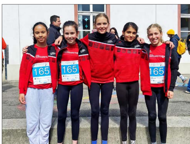
LAR Quer durch Basel: Team U14