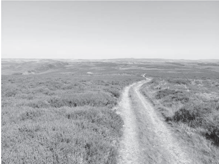
St.Cuthbert's Way, Schottland/England 2023