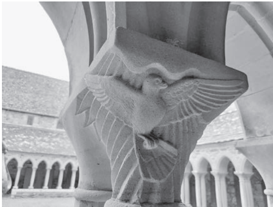
Kreuzgang Iona Abbey in Schottland, © Franziska Eich Gradwohl

Nun aber bleiben Glaube, Hoffnung, Liebe, diese drei; aber die Liebe ist die größte unter ihnen.