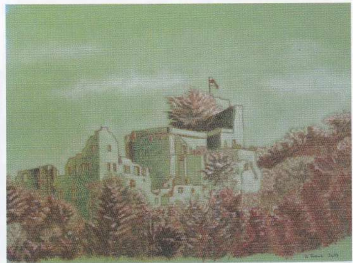
Burguine „Hohenbaden“, Rötel, Kohle, Pastell