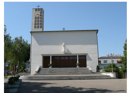
Kirche Maria Lourdes, Aussenansicht

Für die Pfarrei von Bedeutung waren die sozialen Einrichtungen von Maria Lourdes: Die Baldegger Schwestern betrieben von 1936 bis 1981 eine Krankenpflegestation und von 1959 bis 1981 einen Kindergarten. Seit 1939 befindet sich auf dem Pfarreigebiet zusätzlich die Niederlassung der Kapuziner in der Stadt Zürich, welche in der Wallfahrtsbetreuung der Pfarrei mitarbeiten. [8]