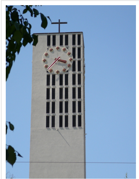
Der Kirchturm von Maria Lourdes

Die Glocken von Maria Lourdes wurden von der Glockengiesserei H. Rüetschi, Aarau im Jahr 1941 gegossen und am 27. April 1941 geweiht. [11] Eine Besonderheit ist, dass das Geläut nicht in einen eigentlichen Glockenstuhl eingebaut wurde, sondern an seinen Jochlagern direkt auf Auskargungen der Betonwand ruht. Die Glockenjoche bestehen nicht aus Holz, sondern aus Stahl. Zwischen den Jochlagern und dem Turm sind Bleiplatten eingelegt, damit die Vibrationen nicht auf den Betonbau übertragen werden. [12]