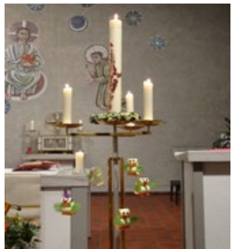
Die neue Osterkerze