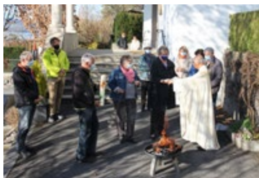
Segnung der Osterkerze am Osterfeuer