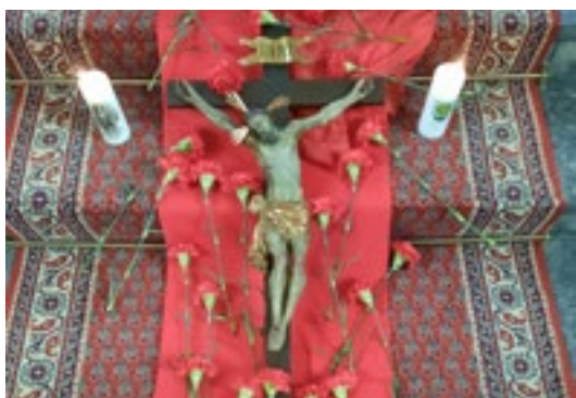
Karfreitags-Ritual in der Kapelle

In der Fastenzeit 2021 konnten an das Fastenopfer-Projekt "Mit Know-how gewappnet gegen Hunger und Wirbelstrürme auf den Philippinen" 209 Franken aus Kehrsiten gespendet werden. Herzlichen Dank!