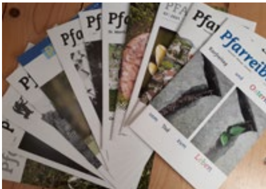
Aktuelle Pfarreiblätter Nidwalden

Vor Kurzem ist die Sonderausgabe des Pfarreiblatts Nidwalden erschienen - bunt, kreativ, informativ und unterhaltsam. Es ist eindrücklich, dass das Pfarreiblatt, dank 25-jähriger