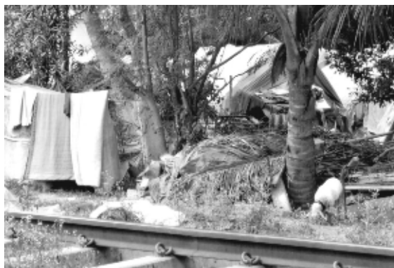
Bidonville à Bangalore

Presque 30% de la population de Bangalore vit dans des bidonvilles et la plupart des habitants travaillent comme travailleurs journaliers ou marchands ambulants. Un quart de la population vit en-dessous du seuil de pauvreté (ce qui signifie avec moins d'un dollar par jour).