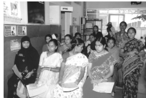
Femmes enceintes attendant le contrôle médical

C'est pourquoi l'une des préoccupations principales de l'Ashram est la consolidation du rôle de la femme en Inde. Ainsi, les collaboratrices visitent les villages dans les alentours de Bangalore. Elles y informent les femmes sur leurs droits, la santé publique, le planning familial, la prévention du SIDA, la possibilité de fonder sa propre petite banque (banque pour microcrédits) etc.