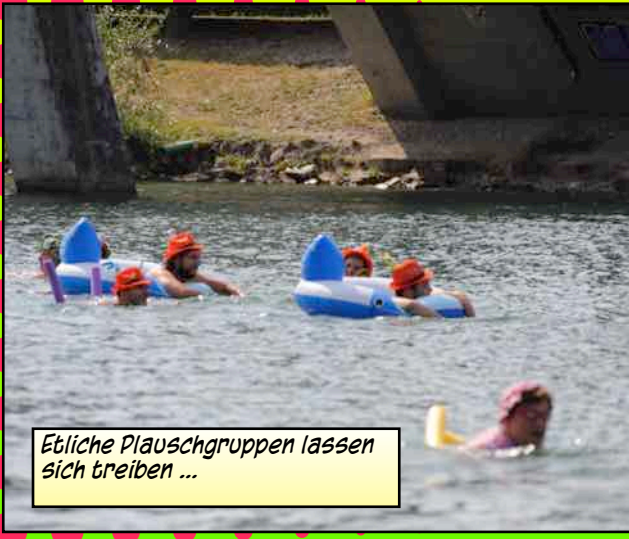
Etlliche Plauschgruppen lassen sich treiben ...