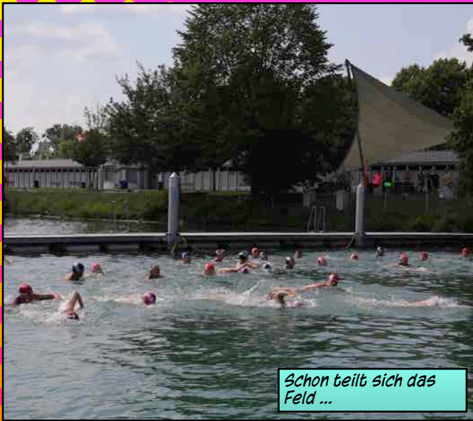
Schon teilt sich das Feld ...