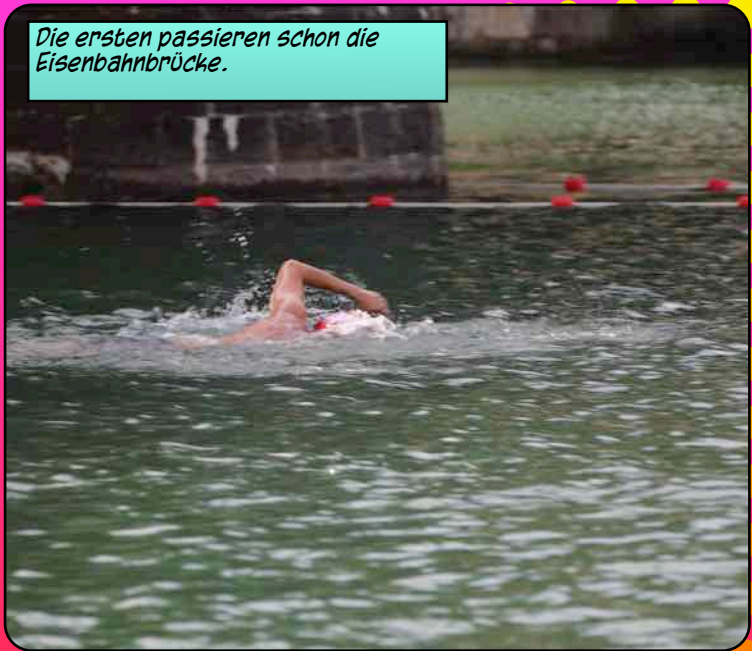
Die ersten passieren schon die Eisenbahnbrücke.