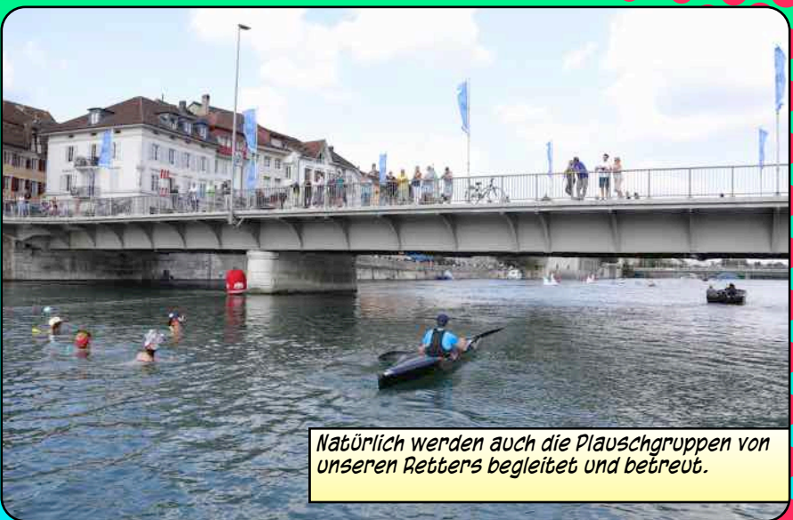
Natürlich werden auch die Plauschgruppen von unseren Rettens begleitet und betreut.