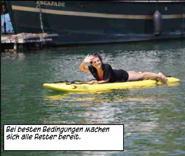
Bei besten Bedingungen machen sich alle Retter bereit.