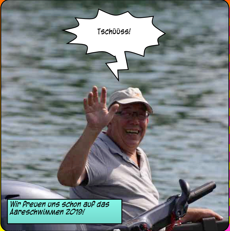
Begleitung auch auf den letzten Metern!