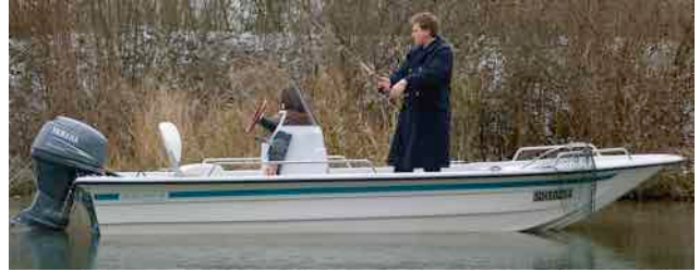
Swiss-Cat 15 ab CHF 8'100.00