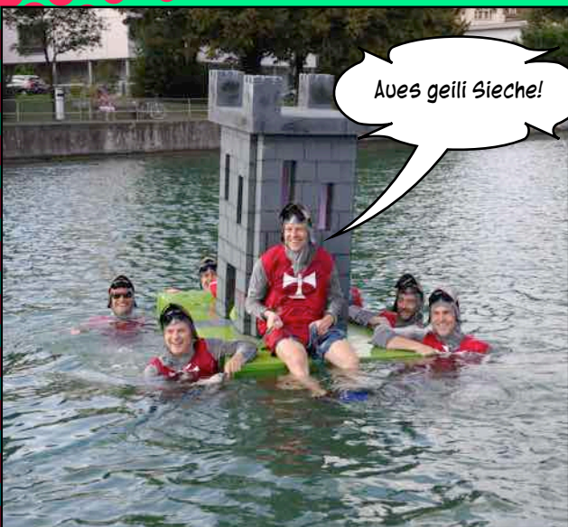
Aues geili Sieche!