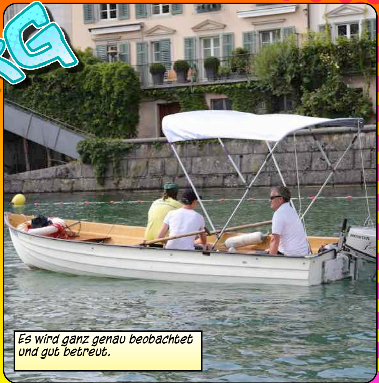
Es wird ganz genau beobachtet und gut betreut.