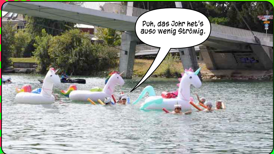
Puh, das Joahr het's auso wenig Strömig.