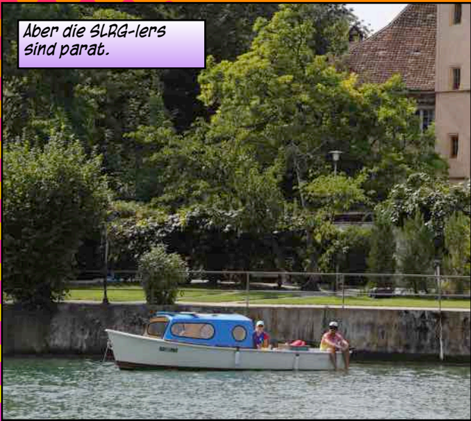
Aber die SLRG-ler sind parat.