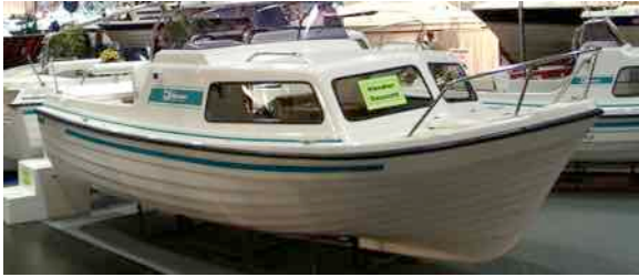
Swiss-Pilotina 500 ab CHF 19'400.00