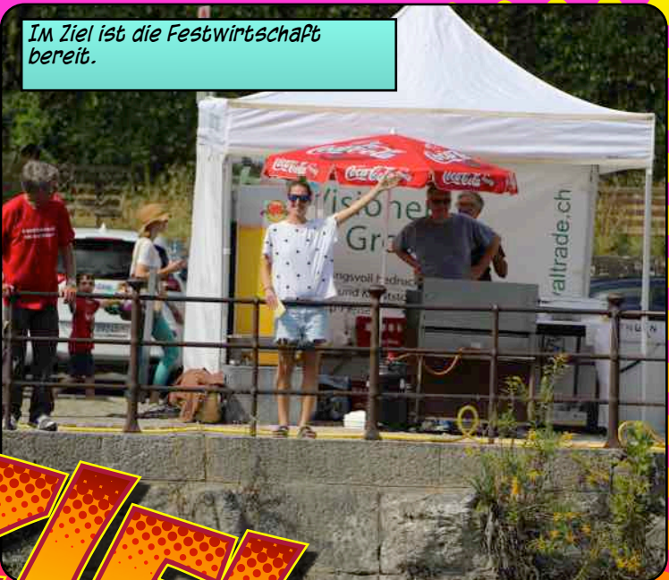
Im Ziel ist die Festwirtschaft bereit.