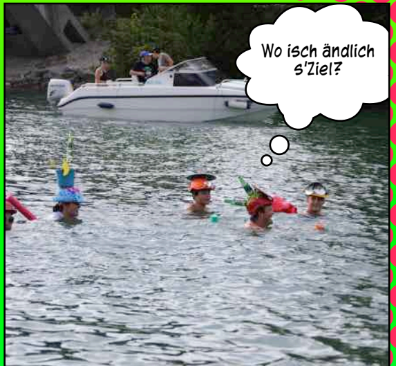
Wo isch ändlich s'Ziel?