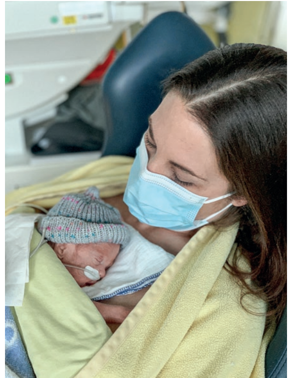
Der intensive Hautkontakt beim «Kanguruhen» fördert Bindung und Entwicklung.