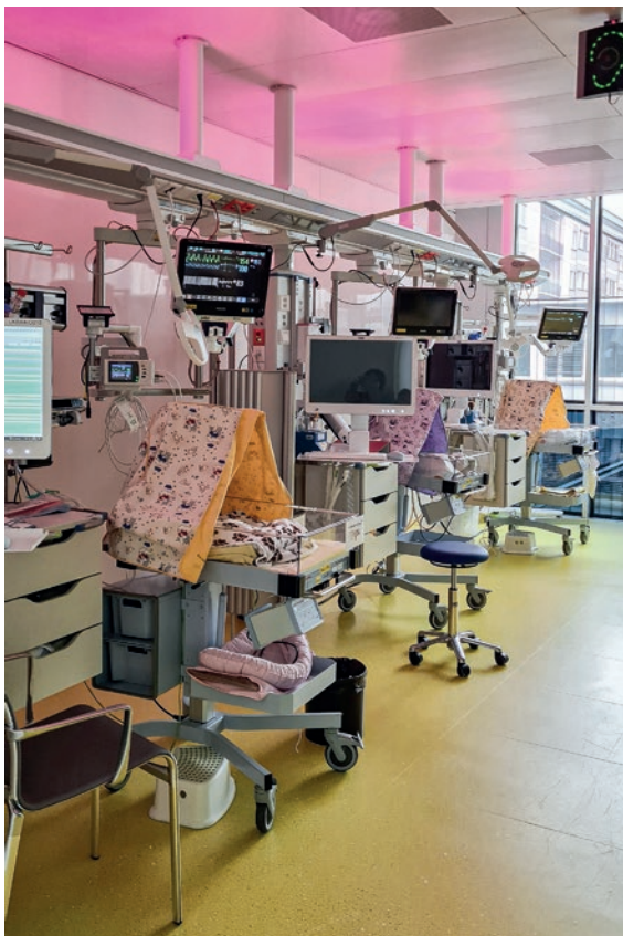
Pink, orange, blau oder grün? Das jeweils passende indirekte Licht schafft eine angenehme Atmosphäre.