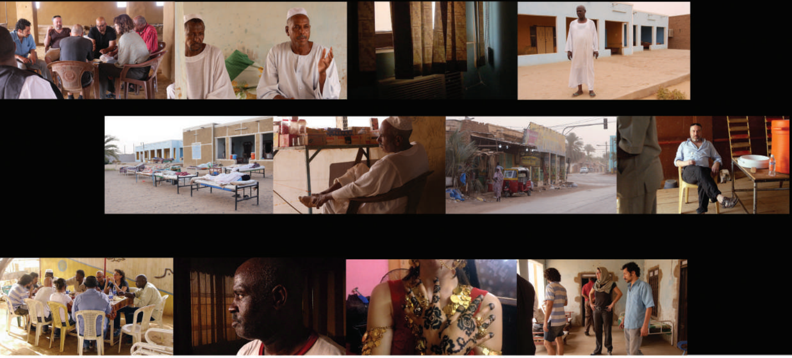
Location Scouting : Various trips took place to possible locations for the film.