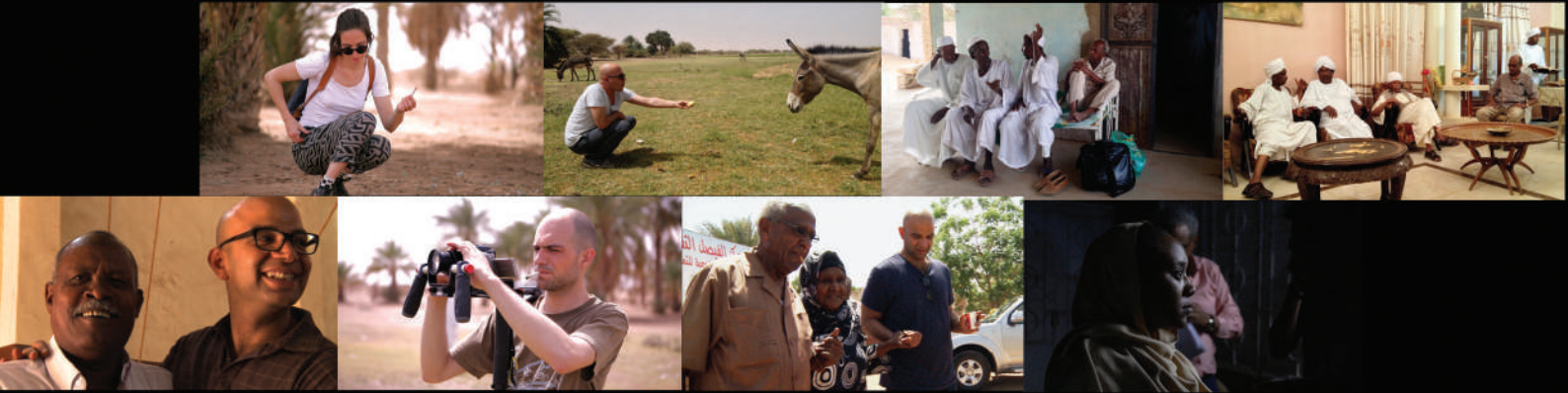
زيارات مواقع التصوير: قام الفريق بزيارات متعددة للتعرف على مواقع تصوير تتعلق بإنجاز فيلم سينمائي عن رواية موسم الهجرة إلى الشمال