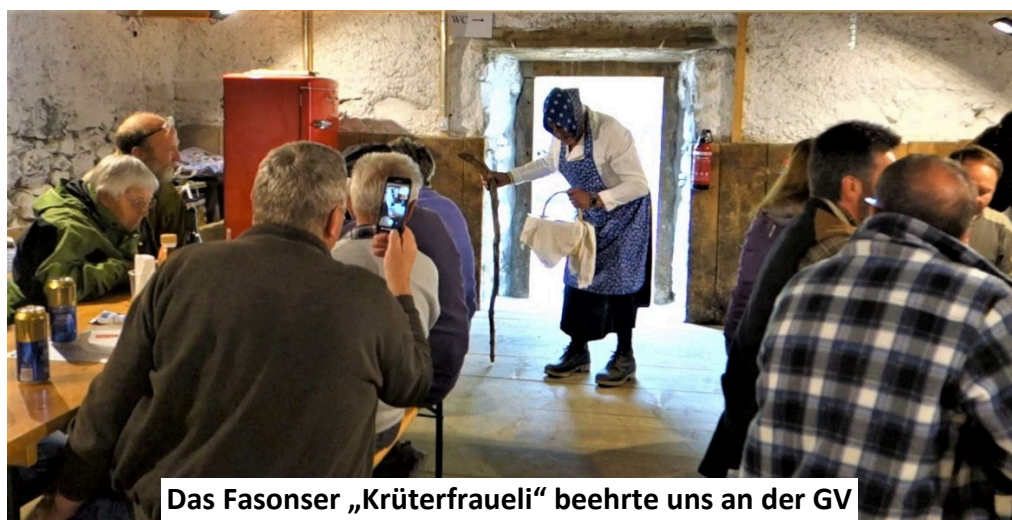
Das Fasonser „Krüterfraue“ beehrte uns an der GV