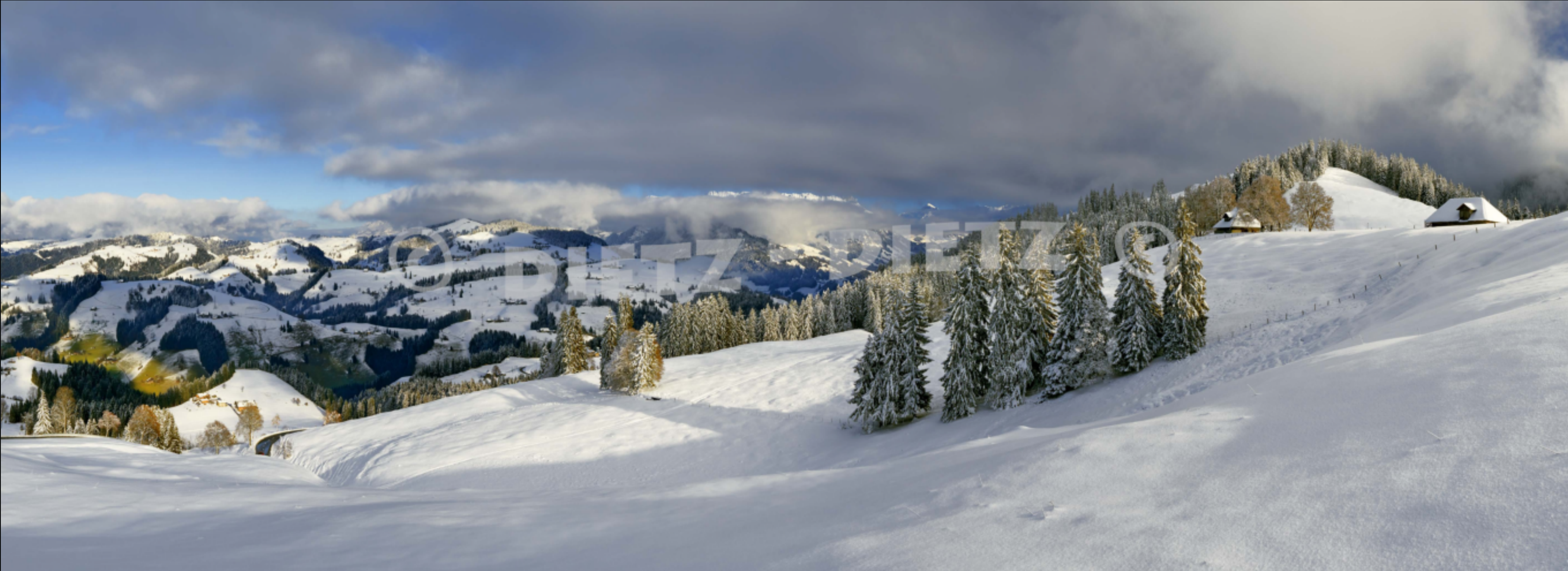
Schallenberg, Emmental (BE)