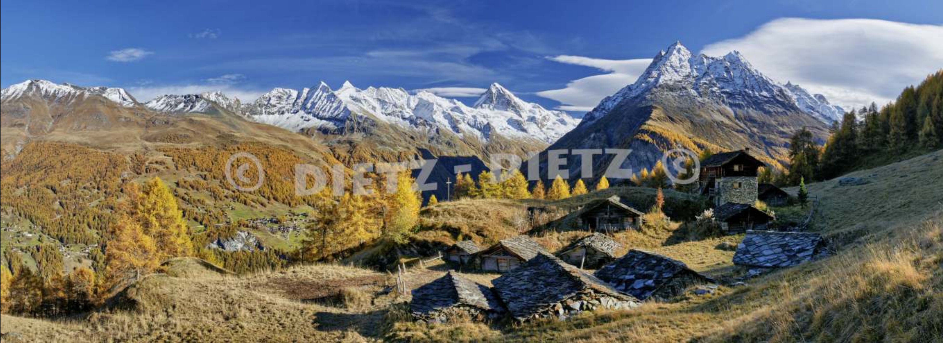
Vald d'Arolla, Arolla - VS