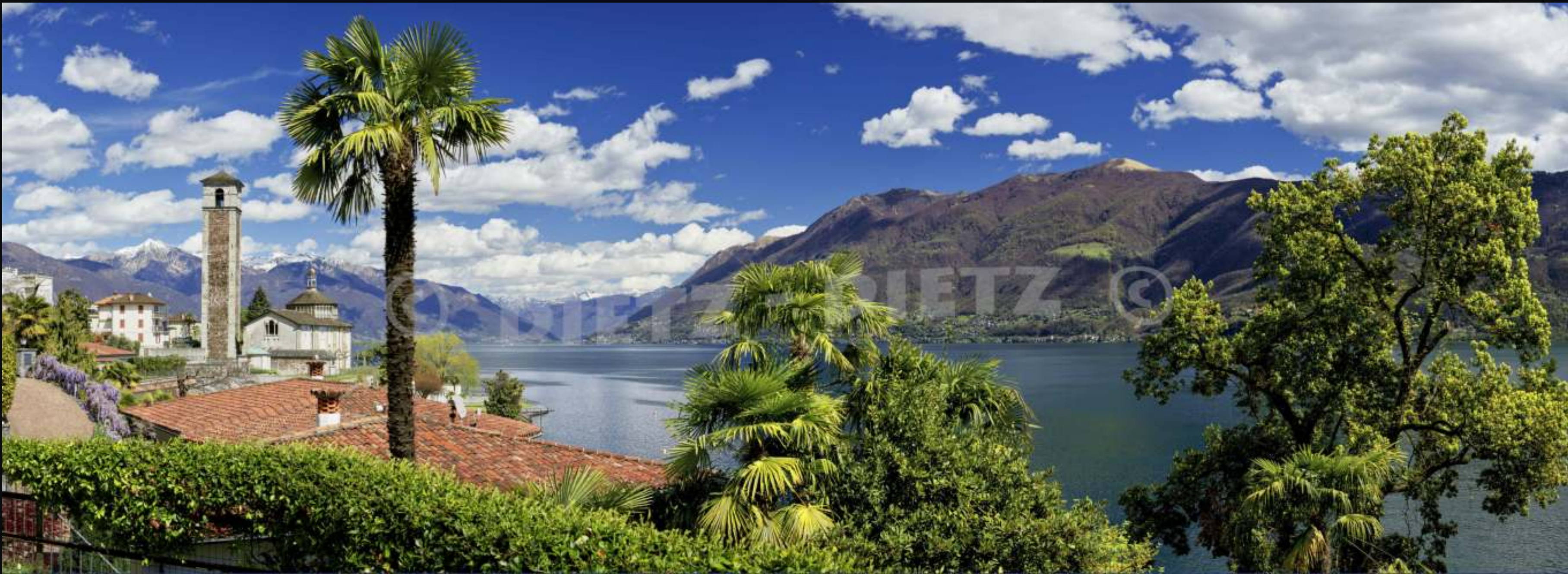
Brissago, Lago Maggiore - TI