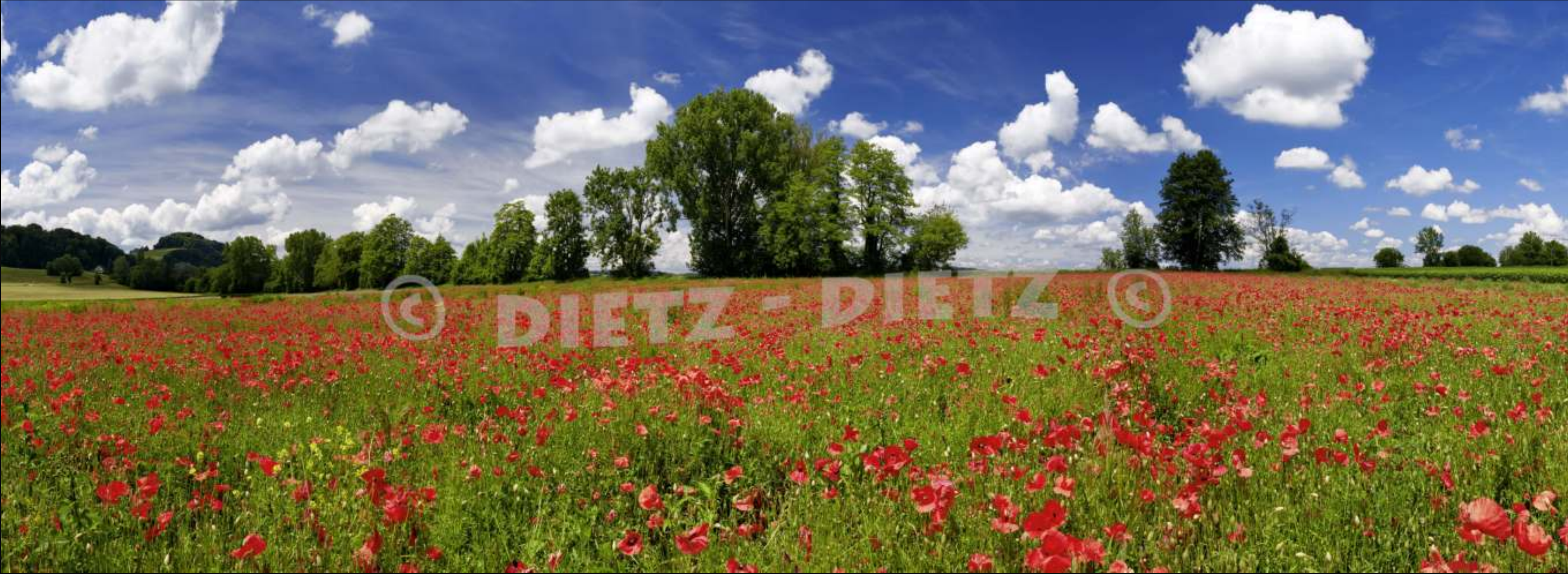
Flaach - ZH