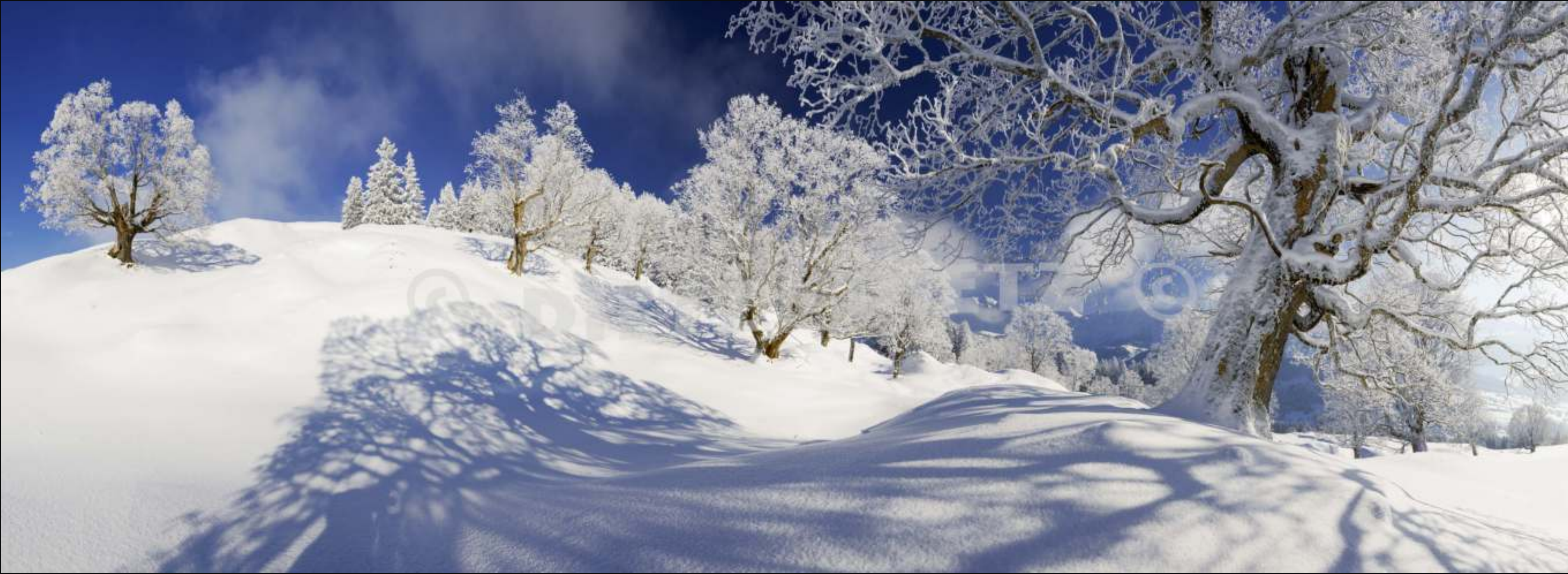
Ennetbühl, Toggenburg (SG)