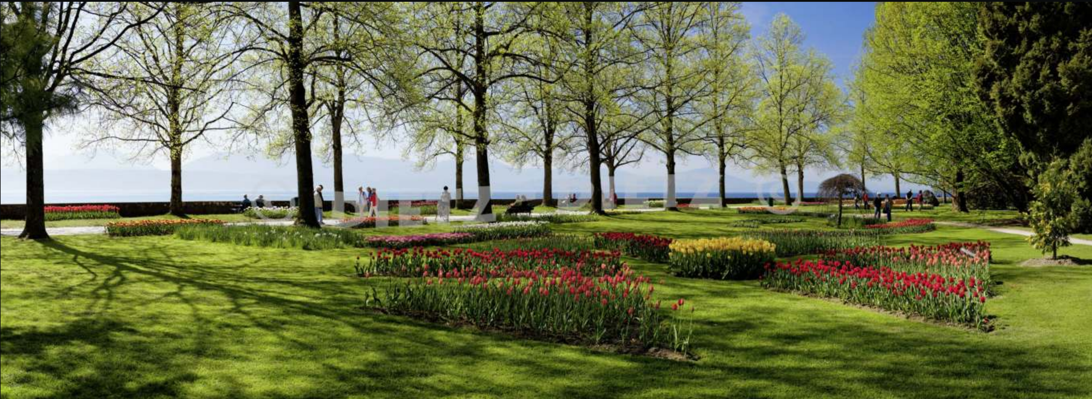
Morges, Fête de la Tulipe (VD)