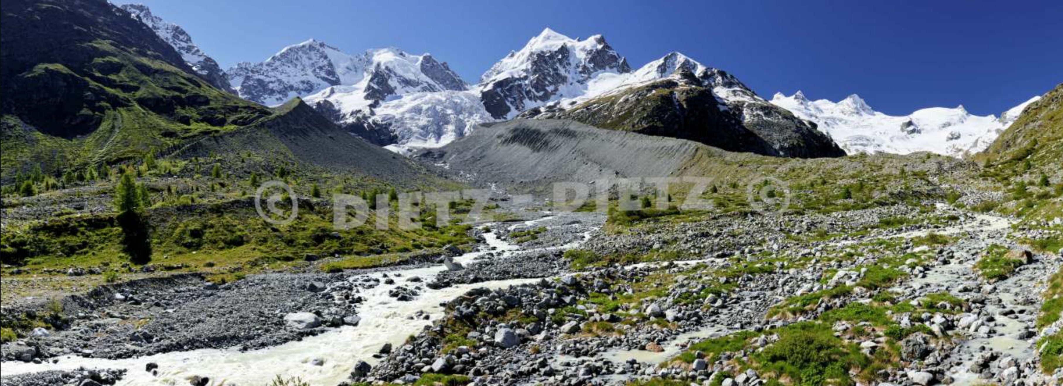
Val Roseg, Piz Bernina 4049m, Piz Roseg 3937m (GR)