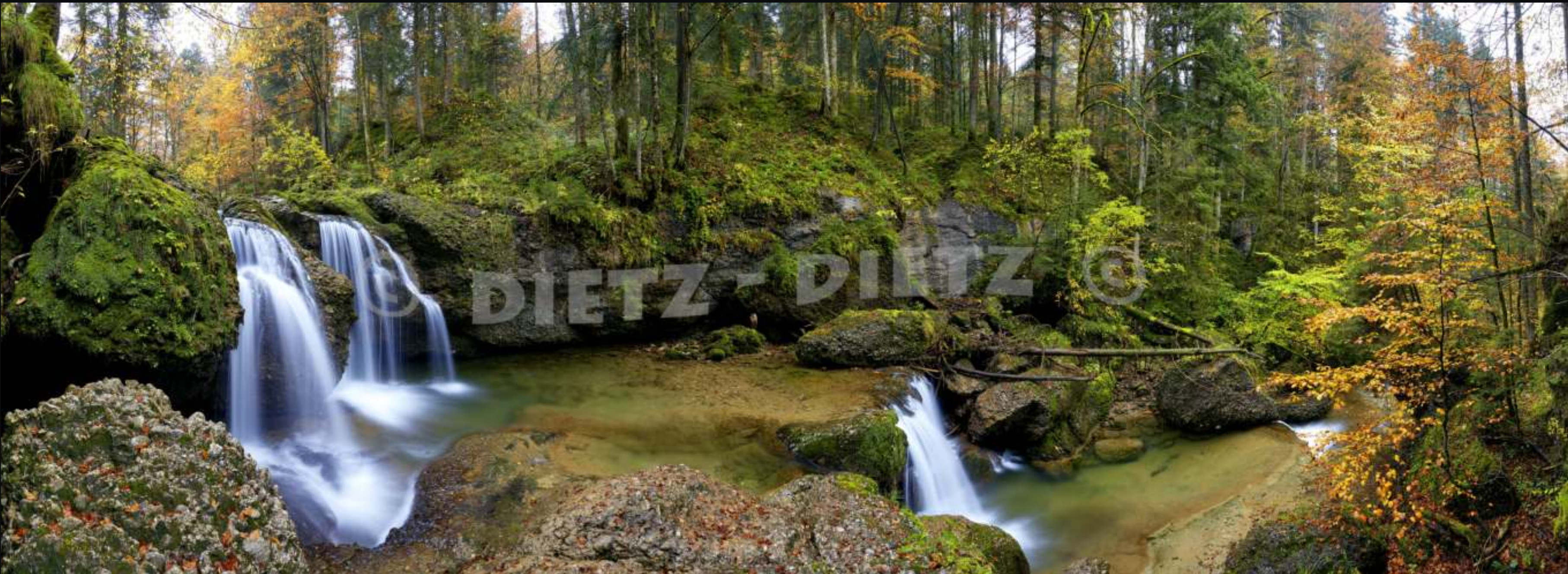
Kaltbrunn, Wängibach (SG)