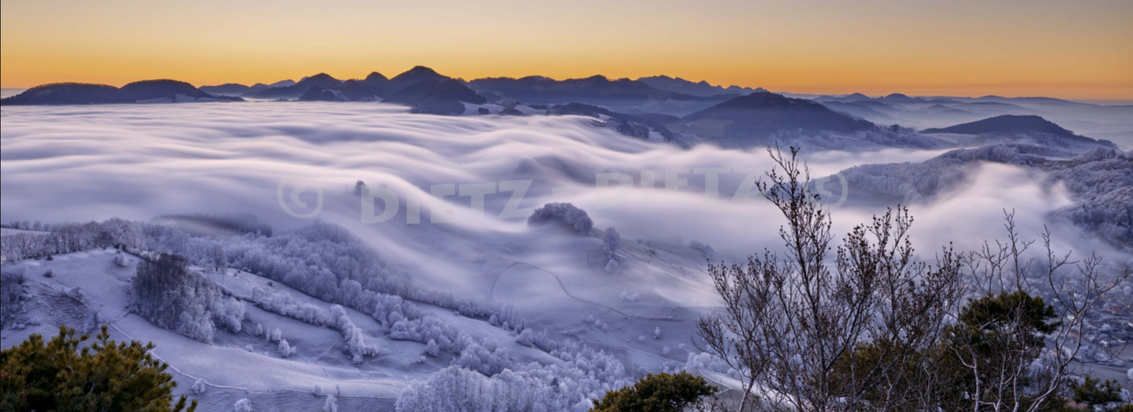
Wisen, Jura (SO)