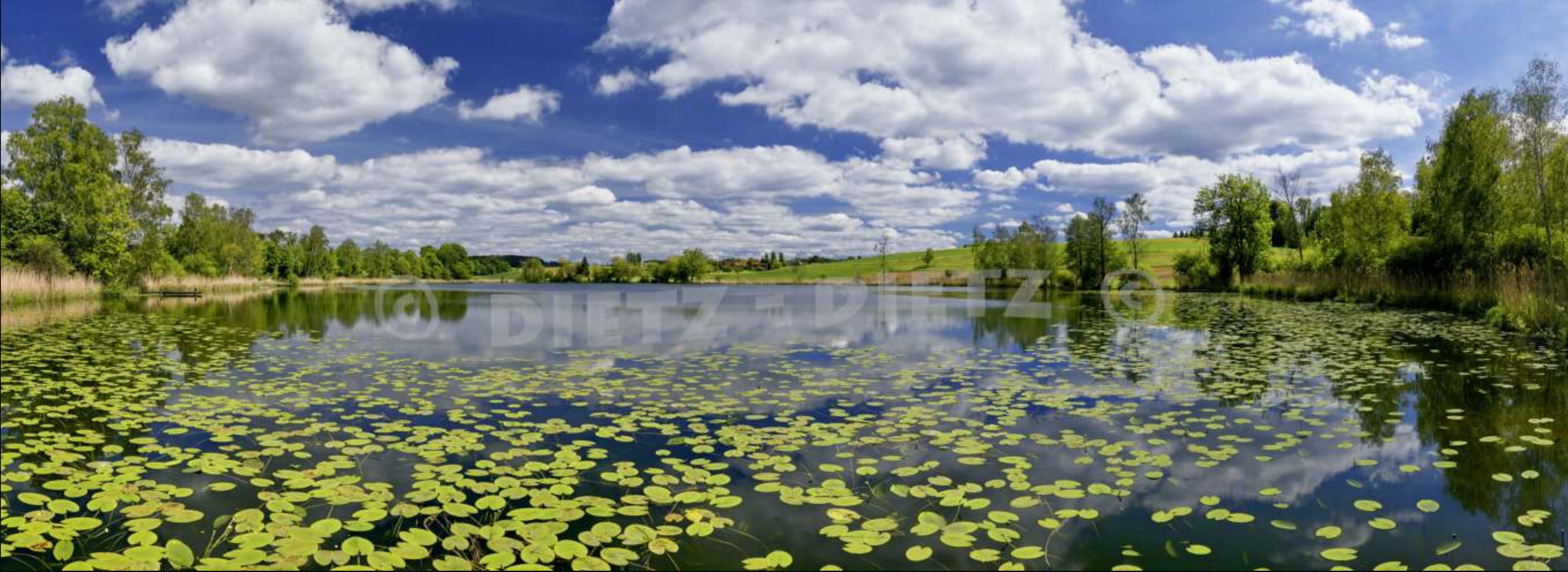
Uerschhausen, Hasesee (TG)