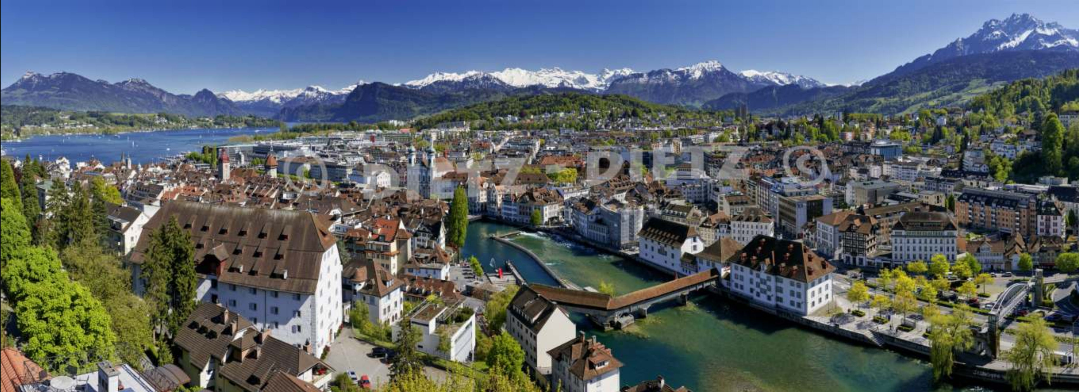
Stadt Luzern (LU)