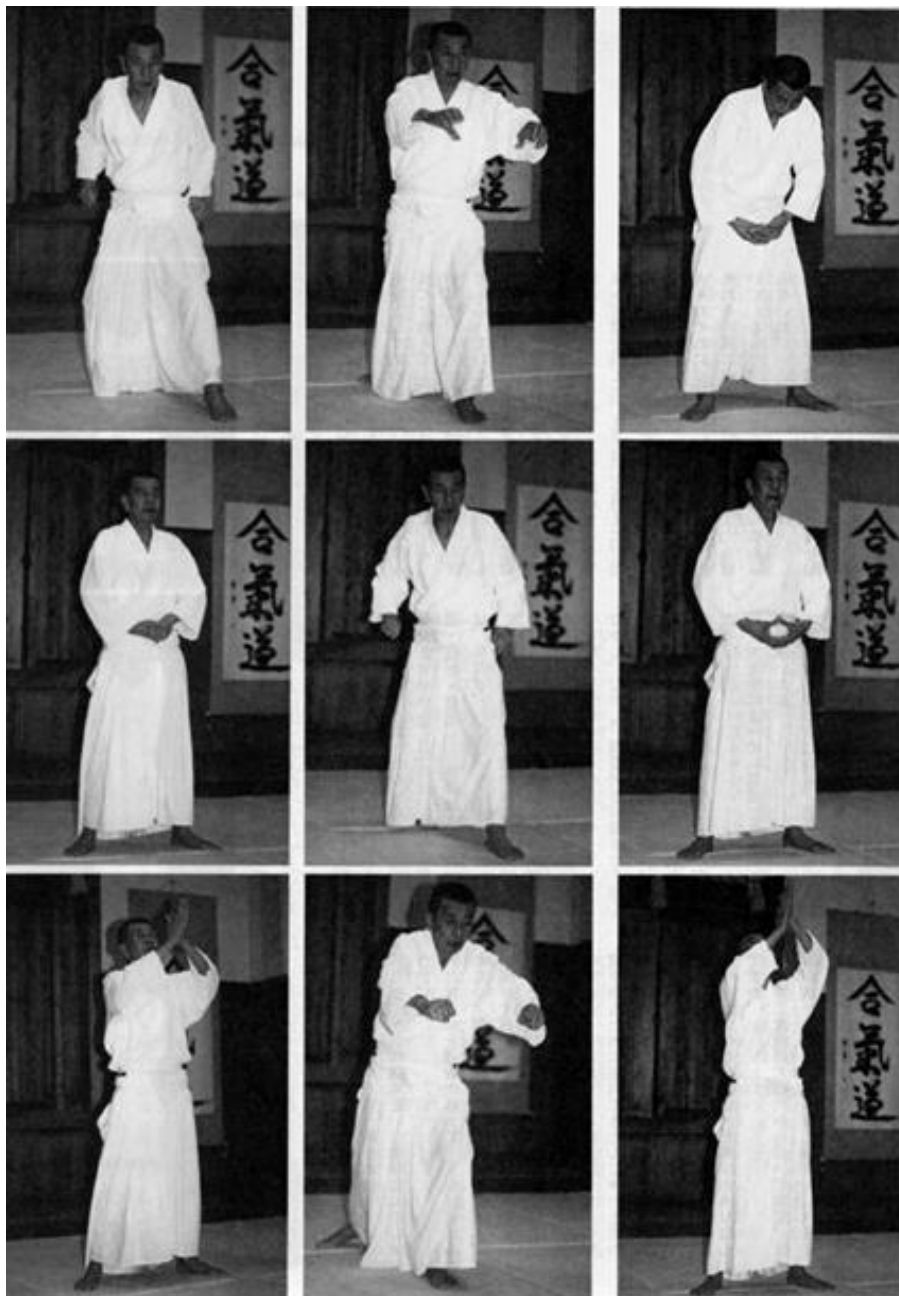
SHIN KOKYU – AME NO TORIFUNE et FURUTAMA NO GYO