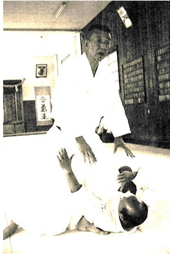
Immobilisation par le Ki à Shingu

Q: Est-ce que O Sensei aussi faisait souvent?