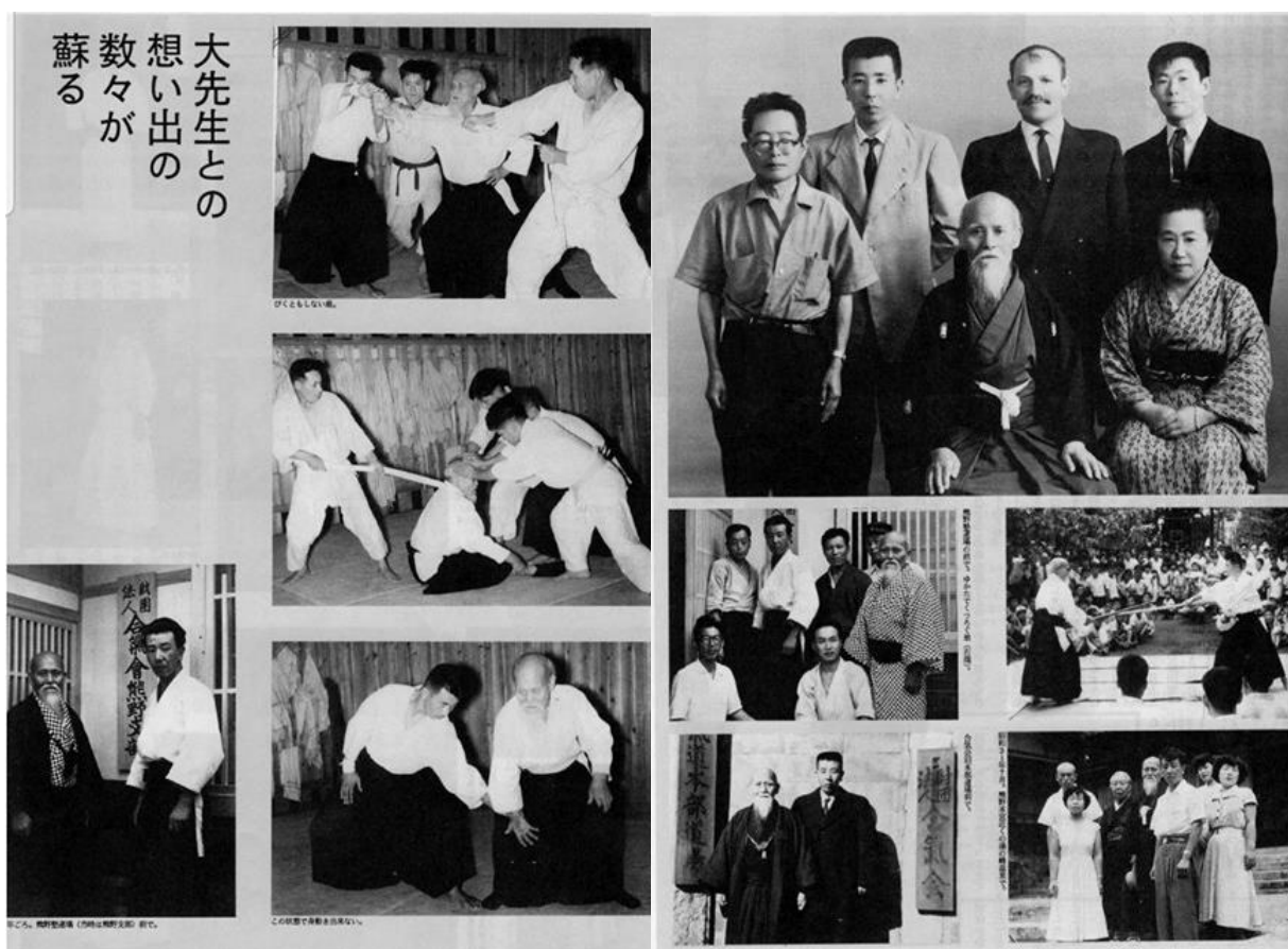
En haut - cela nous rappelle de nombreux souvenirs de O Sensei