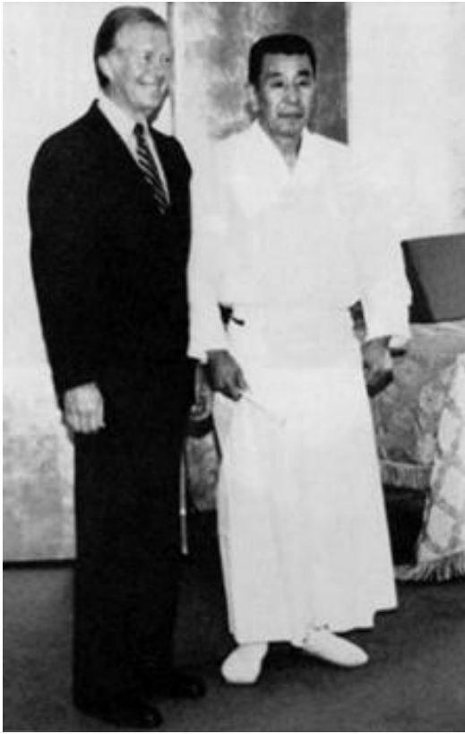
1984 avec Jimmy Carter à Tokyo

R: "Je ne sais pas depuis quand exactement mais quand même depuis longtemps. Normalement, on ne peut faire parce que l'autre peut se lever tout de suite. Je l'ai démontré devant CARTER.