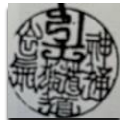
Hikitsuchi Michio 25